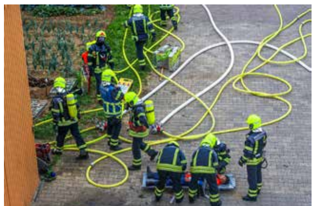
Löschen von Bränden