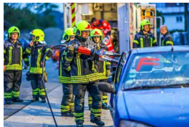
Retten von Personen aus einem Unfallauto mit dem hydraulischen Rettungsspreizer