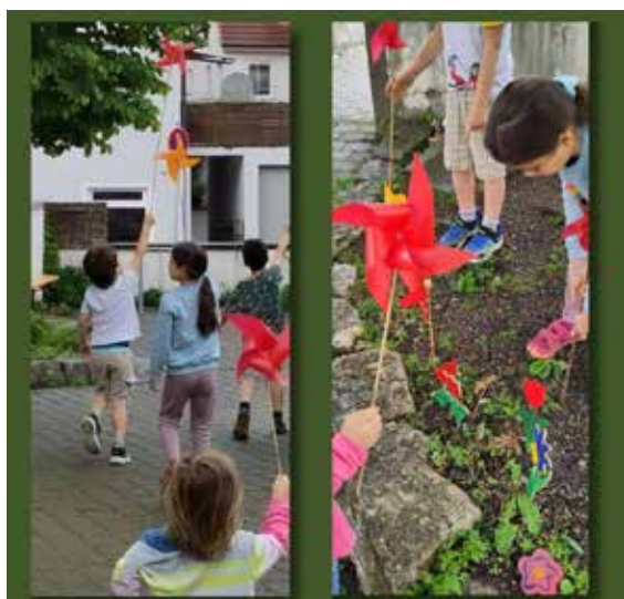
Aktion der Kinderkirche zu Pfingsten

Am Pfingstsonntag feierte die Kinderkirche den Geburtstag der Kirche. Sichtbar wird die Pfingstbotschaft auch im Freien. Im Beet unter dem Judasbaum bewegen sich Windräder im Wind und erinnern daran, dass Gottes Geist die Menschen zu Neuem bewegen kann.