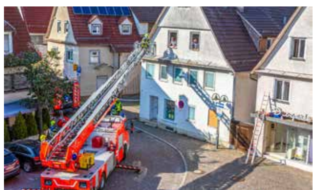
Retten von Personen mit der Drehleiter

Drei Bilder aus der Ausstellung zeigen wir hier.