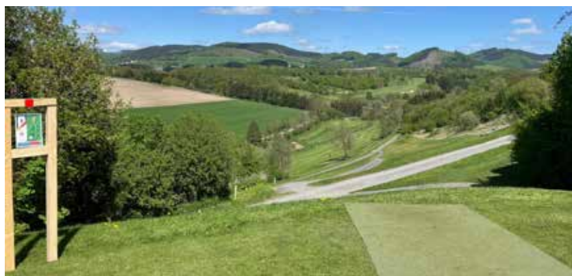
Die Bahn 1 des DM-Kurses in Schmallenberg - Downhill pur!

Für Discgolfturniere eher ungewöhnlich war das Gelände, auf dem die Deutschen Meisterschaften stattfanden. Nur selten wird auf einem Golfplatz gespielt, wobei der Kurs dort nur temporär für das Turnier aufgebaut wurde. Erschwerend kamen hinzu, dass große Höhenunterschiede mit vielen OB-Zonen (Bereiche, die zu einem Strafwurf führen, wenn die Scheibe dort zum Liegen kommt) zu meistern waren, zudem gab es stark wechselhafte Winde, die das Berechnen der Flugbahn deutlich erschwerten.