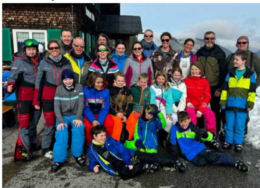
Viel Spaß bei der Familienausfahrt 2024.