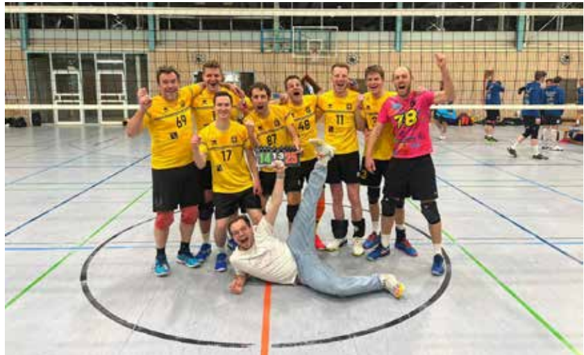
Herren 2 nach dem Coup beim Tabellenersten in Renningen