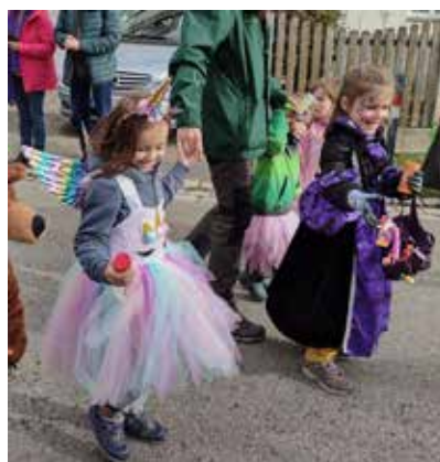
Fröhliche Waldwichtel beim Eninger Faschingsumzug

Vielen Dank für den Besuch und wir freuen uns auf ein Wiedersehen im nächsten Jahr.