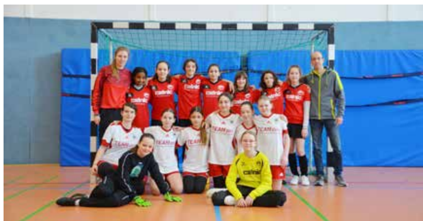
Unsere D Mädchen