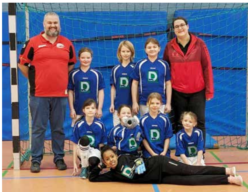
Unsere Jüngsten - die E-Mädchen