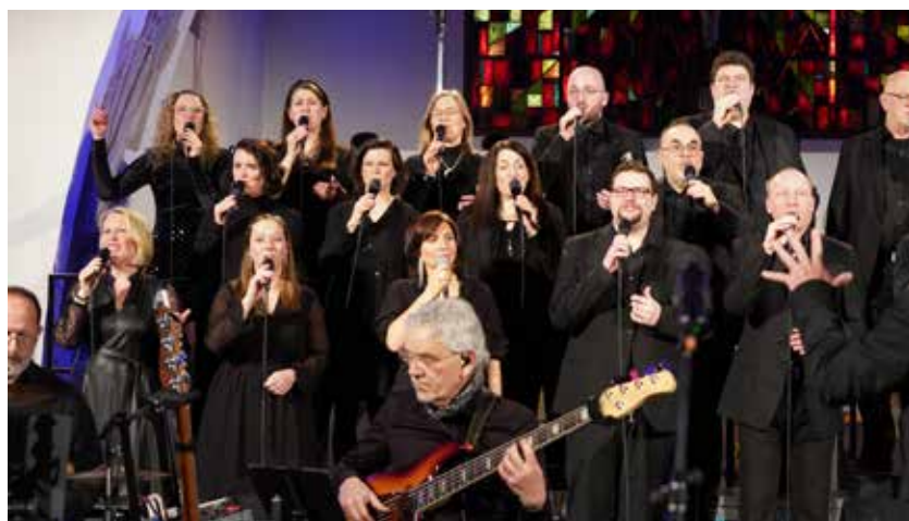
Begeisterte und begeisternder Chor mit Band