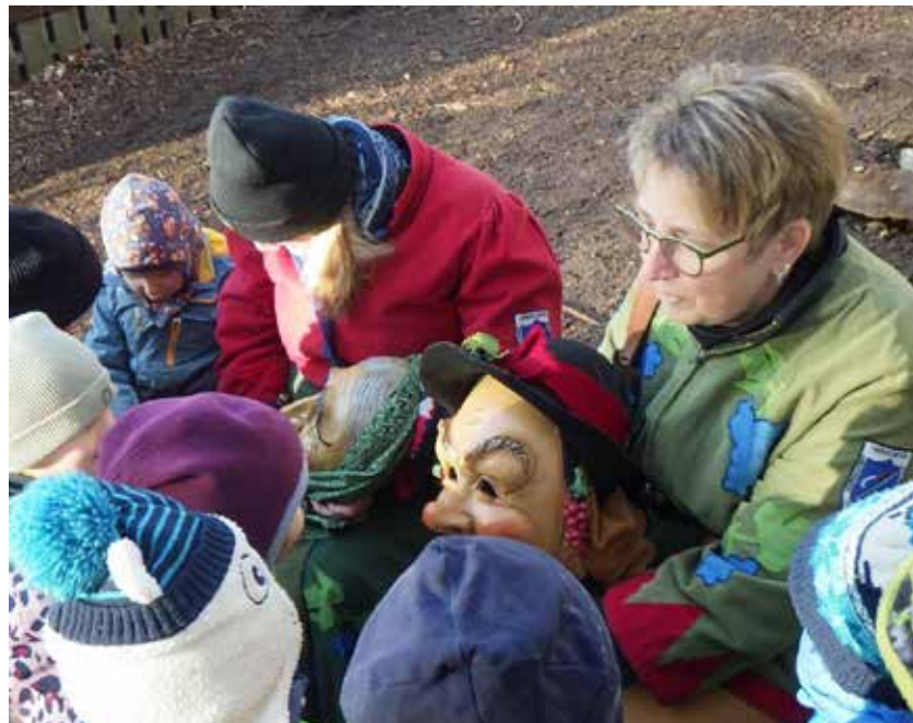
Masken zum Anfassen