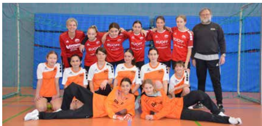
Beide Mannschaften der C-Mädchen