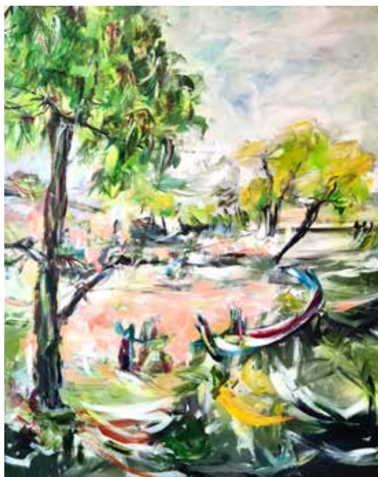
Karl Striebel: „gestrandet“, Acryl auf Leinwand

Vernissage 23. Februar 2024, 19.00 Uhr, Rathausfoyer Eningen