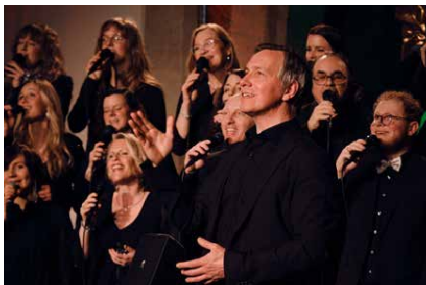
Jetzt Karten kaufen für das LAKI-Popchor-Konzert

Karten im Vorverkauf gibt es im Gemeindebüro, Hauptstraße 62, im Werkstattladen Lieblingsstück, Hauptstraße 48 in Eningen oder in der Buchhandlung Philadelphia, Oberamteistraße 9 in Reutlingen.