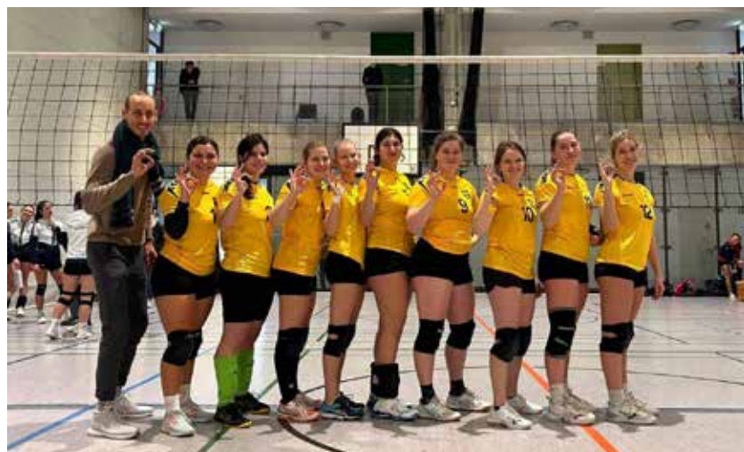
Damen 2 nach der Niederlage in Tübingen