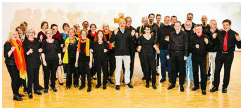
Der Reutlinger Gospelchor kommt am Sonntag in die Andreaskirche