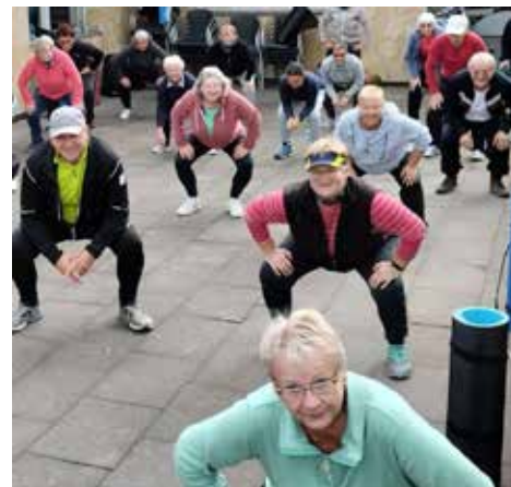
Rehasport macht Spaß und hält fit!

Die nächsten Termine sind damit: 24.01.2024, 31.01.2024, 07.02.2024, ..... Anmeldung und weitere Infos unter 07121 55 08 18