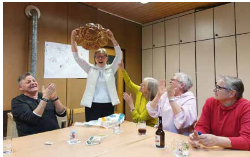
Die Gewinnerin mit ihrer Riesenmutschel