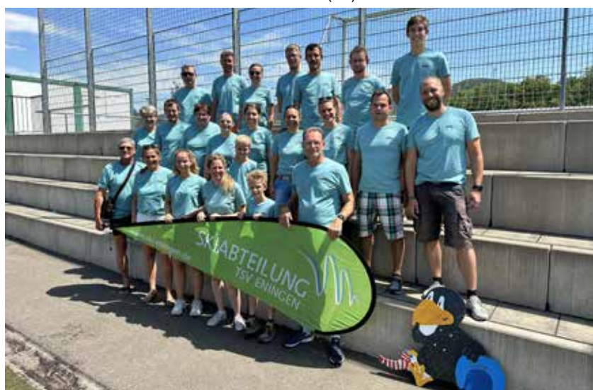
Die Helfer der Skiabteilung im neuen Outfit

Auch an der Spielstation der Skiabteilung als Teil des Jubi-Parcours hatten die Teilnehmer viel Spaß beim Badminton-Zielschießen, Stelzen laufen und Pedalo fahren. Eine nicht ganz einfache Koordinationsübung für Freunde und ganze Familien war das ‚Langlaufen‘; dabei mussten sich 3-4 Personen parallel auf 2 langen Ski vorwärtsbewegen und eine Wippe überwinden. Die Betreuer der Skiabteilung hatten viel Spaß bei den unterschiedlichen Techniken. Alles in allem eine sehr schönes und gelungenes Festwochenende. Vielen Dank an alle Helferinnen und Helfer (FS).