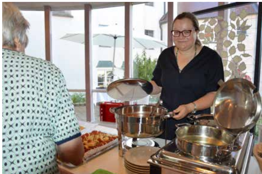
...und freundlich serviert