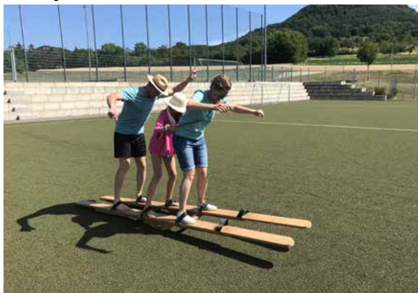
Viel Koordination war bei der Langlaufstation gefragt