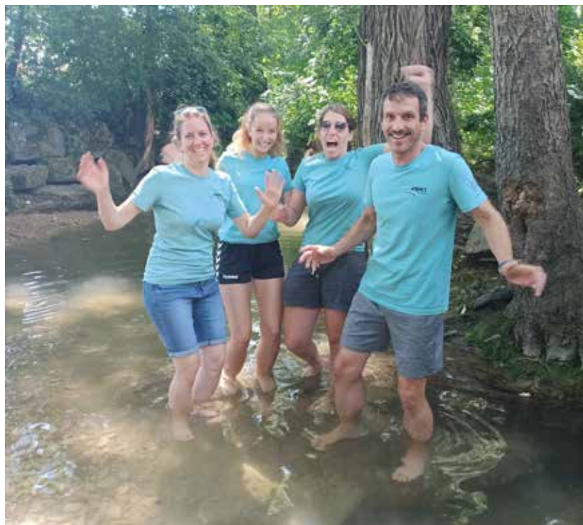
Abkühlung im Arbach