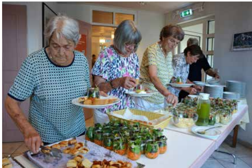
Ein leckeres Buffet