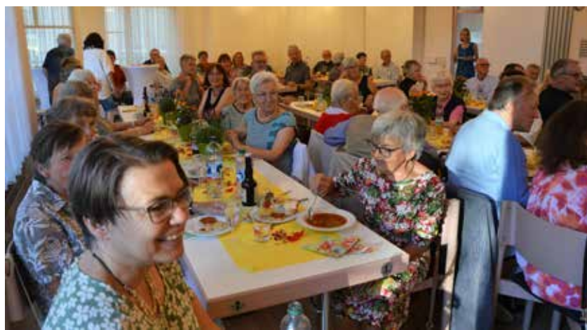
Volles Haus beim "Danke-Abend" für die Ehrenamtlichen