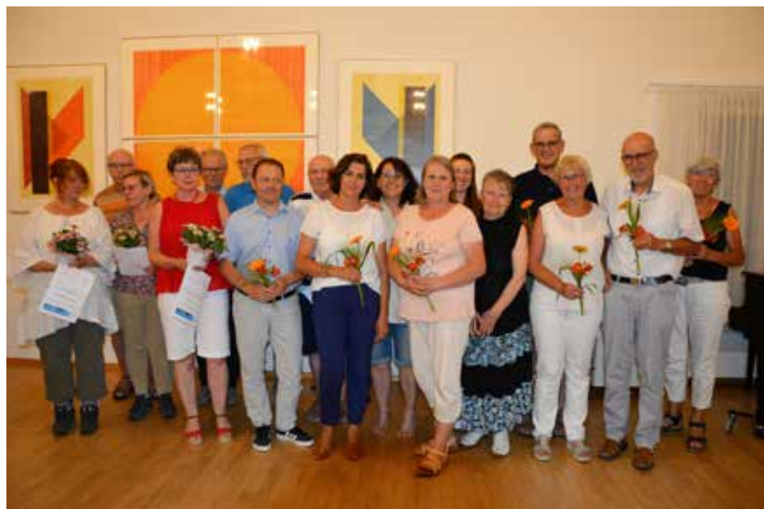
Langgediente wurden geehrt, Neue willkommen geheißen