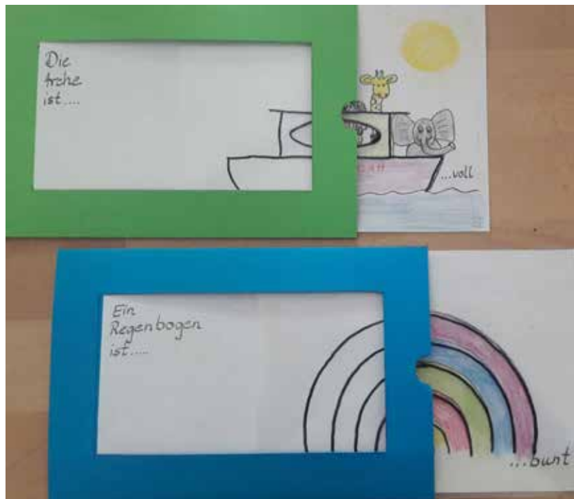
Zauberhafte Karten, von den Minis bemalt