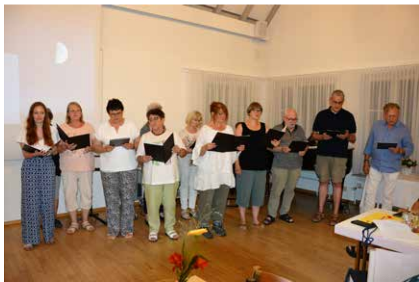
Der neue Chor singt für's Ehrenamt