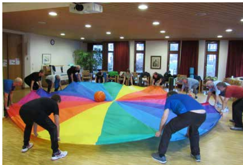
Übung mit Schwungtuch

Er findet immer Mittwochs von 10:30 Uhr – 11:30 Uhr in der Sporthalle des SKV Eningen, Geißbergstr. 36 in Eningen statt. Informationen gerne unter: 07121/ 1360723. Es ist ein AB geschaltet.