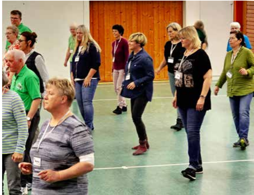
Cindy Holmberg MdL war zu Besuch bei den Line Dancern

Zwar etwas erschöpft, doch wieder mit einem Lächeln im Gesicht traten alle mit Vorfreude auf einen neuen Tanz beim nächsten Übungsabend nach gut 1,5 Stunden intensivem Training den Heimweg an.