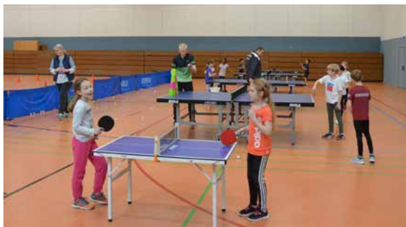
Profis am Minitisch