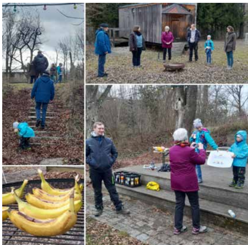
Wohin bloß mit der Feuerstelle?

Bei einem "Feuerstellenworkshop" konnten sich Vereinsmitglieder, Mitarbeiter, Betreuer und FerienprogrammKinder über einen neuen Ort für unsere Feuerstelle Gedanken machen. Diese ist nämlich eines unserer Herzstücke auf dem Vereinsgelände. Doch leider sind wir mit dem Platz nicht mehr zufrieden. Die immer trockener werdenden Sommer erfordern einen höheren Sicherheitsabstand der Feuerstelle zu unserer Pflanzenwelt. Es wurde ein Plan ausgeheckt und schnell ein neuer Ort für die Feuerstelle gefunden. Das Spielmobil muss Platz machen und beschert uns damit eine schöne Fläche bei der man hoffentlich bald so richtig schön zusammen sitzen und das knisternde Feuer genießen kann. Zum Abschluss des gelungenen Workshops gab es noch Schokobananen vom Grill. Nur wenige Wochen danach fand der erste Arbeitseinsatz des Jahres statt, bei dem nicht nur die Laubberge von fleißigen Helfern beseitigt wurden, sondern auch das Spielmobil umgezogen ist.