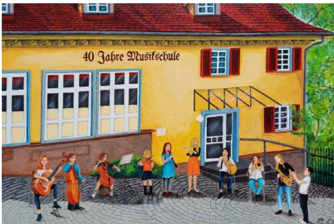
Gemälde anlässlich des 40. Jubiläums der Musikschule Eningen – Künstlerin: Francis Pürthner