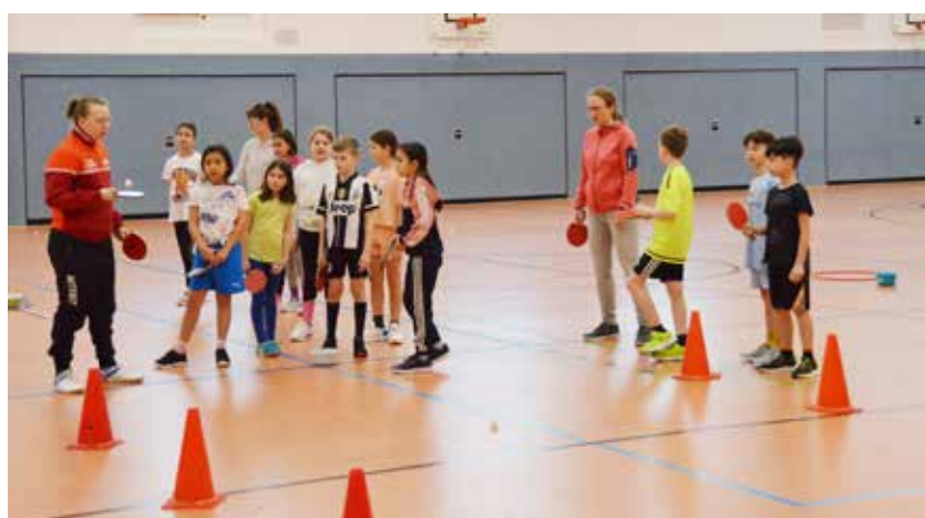
Einführung in den Parcours

Verpflegungskosten inklusive. Anmeldung bis Fr 14.04.2023 bei vk1@landvolk.de oder unter 0711 9791-4580. Teilnehmerzahl begrenzt