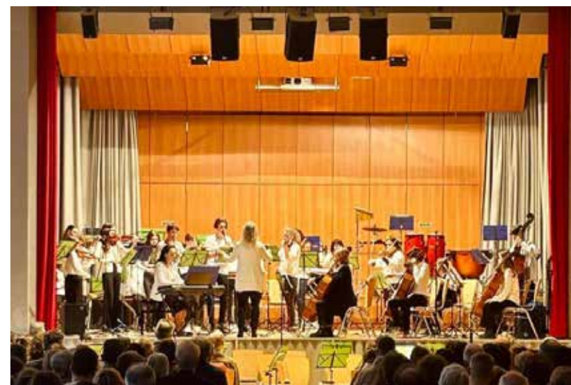
Streicherensemble – Leitung: Sigune Lauffer