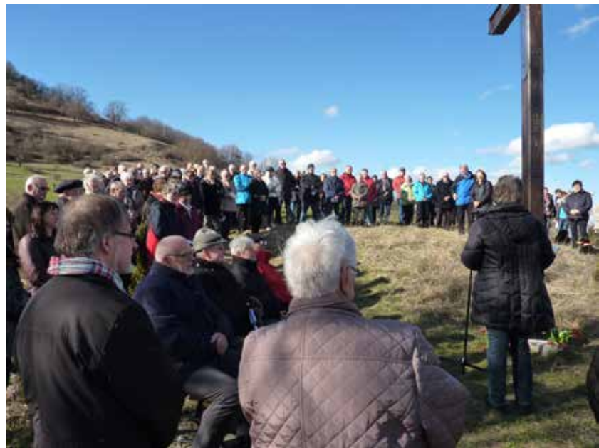
Ostermontag an der Achalm

Auf dem Kreuzbuckel werden wir gegen 17 Uhr einen ökumenischen Gottesdienst feiern, zusammen mit den anderen, die schon dort sind und dem Posauenchor. Dazu laden wir herzlich ein!