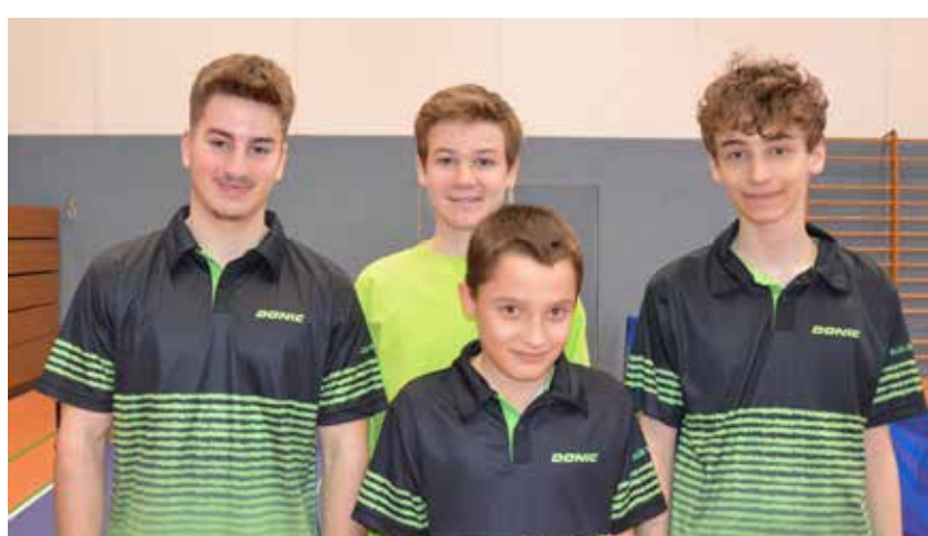
Jungen U19 Bezirksliga