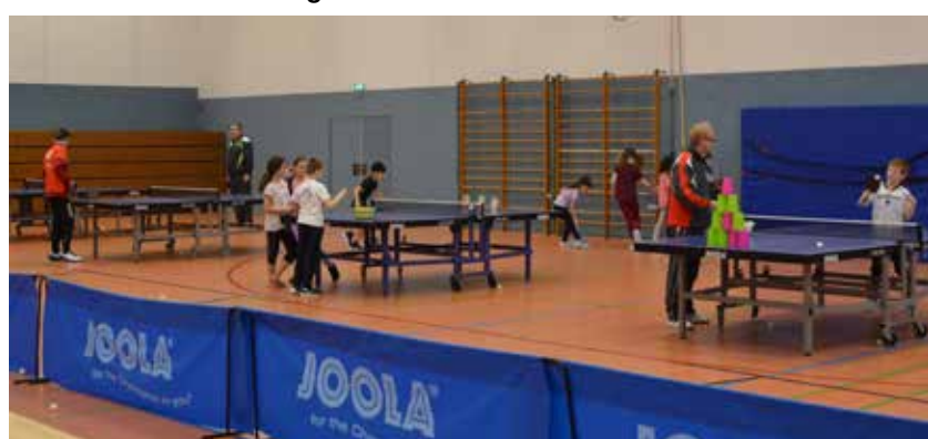
Verschiedene Stationen konnten ausprobiert werden