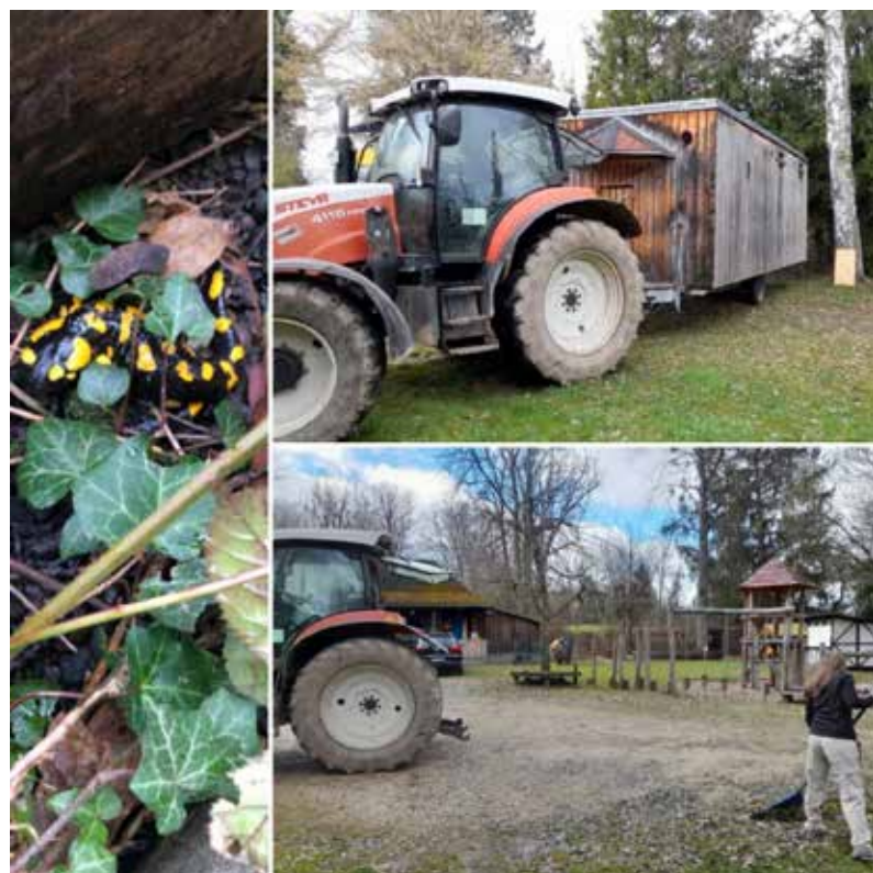
Das Spielmobil muss umziehen...