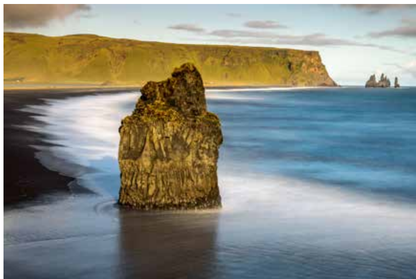
Ein letzter Blick auf Island

Unsere Multivisionsschau am 17. März ist auf großes Interesse gestoßen. Über hundert Naturliebhaber haben sich von uns nach Island mitnehmen lassen. Das Echo war durchweg positiv. Wir bedanken uns bei unseren Besucherinnen und Besuchern. Die nächste Multivisionsschau über die Schwäbische Alb planen wir für Ende November – nicht mit eigenen Fotos, sondern mit Bildern der GDT, der Gesellschaft für Naturfotografie.