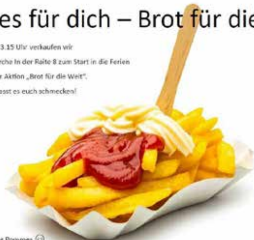
EmK Eningen, Abteilung Pommes

am Freitag 31.03. ab 13.15 Uhr verkaufen wir vor der Versöhnungskirche in der Raite 8 zum Start in die Ferien Pommes zugunsten der Aktion „Brot für die Welt“. Kommt zahlreich und lasst es euch schmecken!