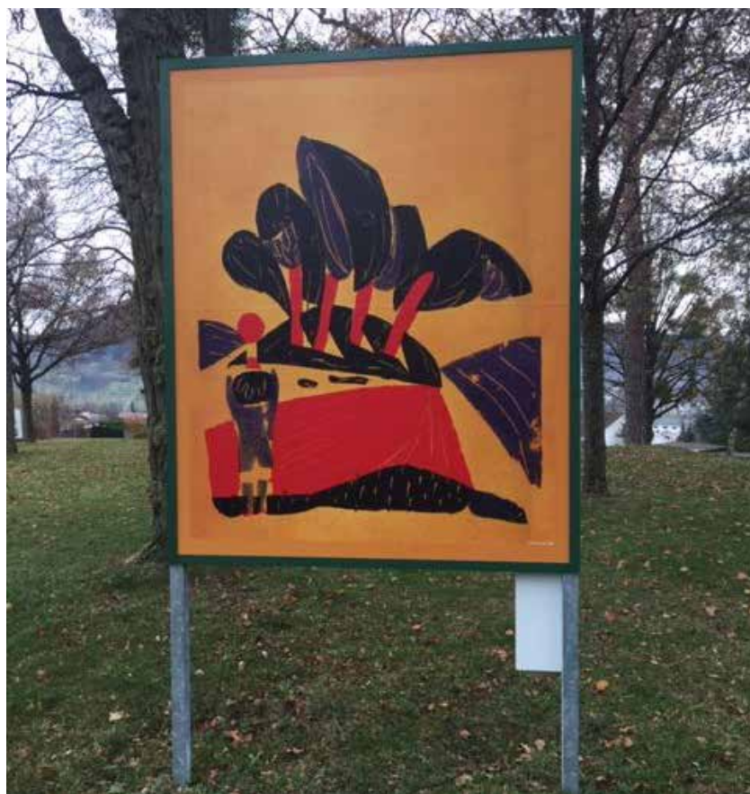
Der HAP Grieshaber Weg auf der Eiferthöhe