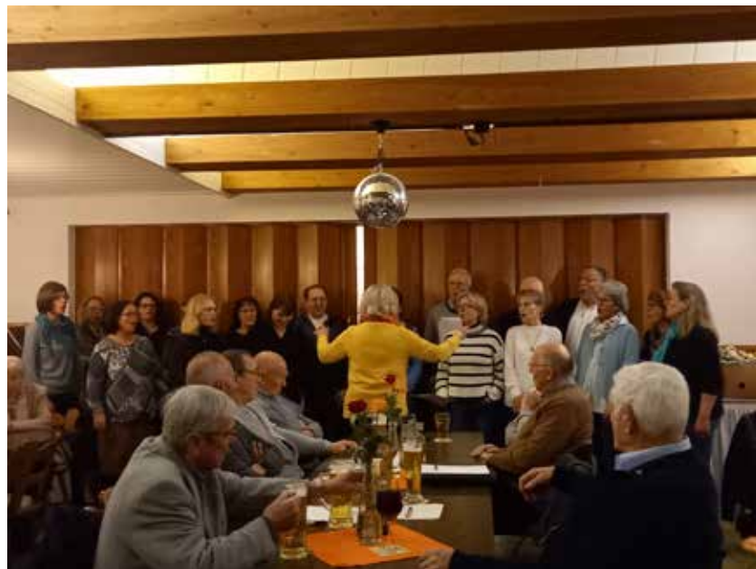
music and more bei der Eröffnung