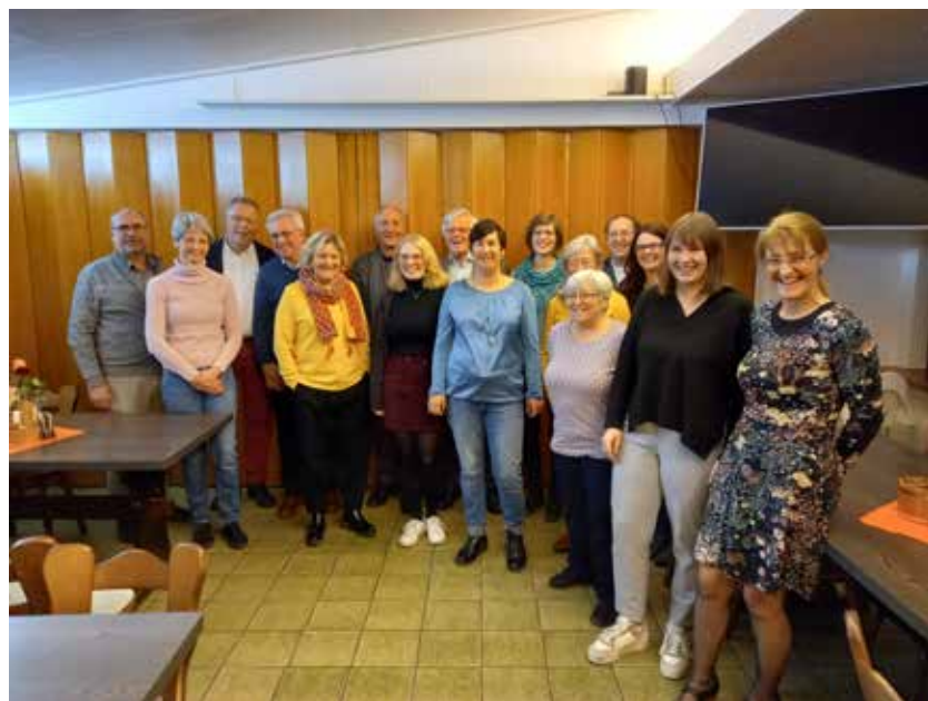
Vorstand, Ausschuss inkl. neuer und scheidender Mitglieder und Chorleiterin

Aktuelle Informationen aus Ihrer Nähe – Ihr Mitteilungsblatt.