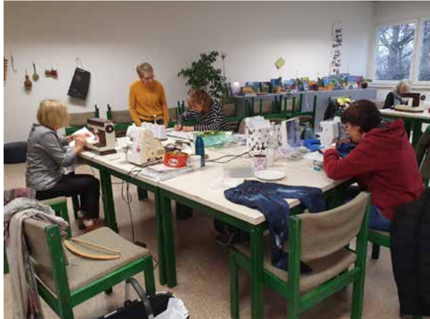
Nähtreff im Januar 2023

Telefonisch sind wir dienstags und donnerstags zwischen 14.00 und 16.00 Uhr unter der Tel. Nr. 015115613142 erreichbar.