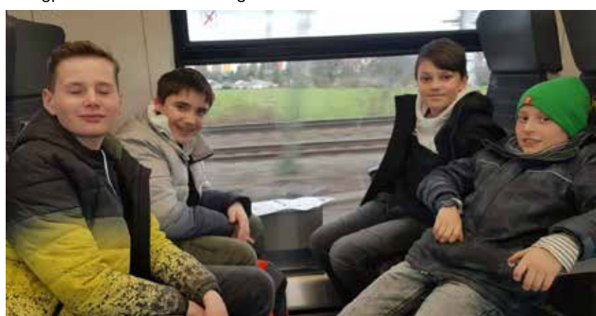
Zufrieden auf der Rückfahrt...

Wenn schon einmal die Deutschen Tischtennismeisterschaften für Mädchen und Jungen unter 15 Jahren in Baden-Württemberg stattfinden, muss man da hin. Das sagten sich die verantwortlichen Jugendleiter der TSV-Tischtennisabteilung und haben am Sonntag zum Finaltag einen entsprechenden Jugendausflug angeboten. Die zweistündige Anreise mit der Bahn hat sich allemal gelohnt. Achtel-, Viertel-, Halbfinale und die entsprechenden Finale in den Kategorien Mädchen und Jungen Einzel und Doppel unter 15 Jahren begeisterten die Zuschauer. Interessant am Rande war auch die totale Verkabelung der Sporthalle, um die Spiele für spätere Nachbesprechungen aufzuzeichnen oder den Livestream in YouTube abzubilden. Die Live-Kommentatoren sah man so direkt bei der Arbeit. Zahlreiche Emotionen, tolle Ballwechsel und eine hervorragende Stimmung auf den Zuschauerrängen konnten die jungen Ausflügler der Tischtennisabteilung während der gesamten 3 Stunden Anwesenheit staunend aufnehmen. Beste Technik und Athletik motivierten so für die eigenen zukünftigen Trainingseinheiten. Mit vielen neuen Eindrücken und zahlreiche Einblicke in den semiprofessionellen Tischtennissport kehrten die 8-14jährigen "Jungprofis" zurück nach Eningen.