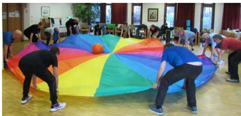
Übung mit Schwungtuch

Er findet immer Mittwochs von 10:30 Uhr – 11:30 Uhr in der Sporthalle des SKV Eningen, Geißbergstr. 36 in Eningen statt. Informationen gerne unter: 07121/ 1360723. Es ist ein AB geschaltet.