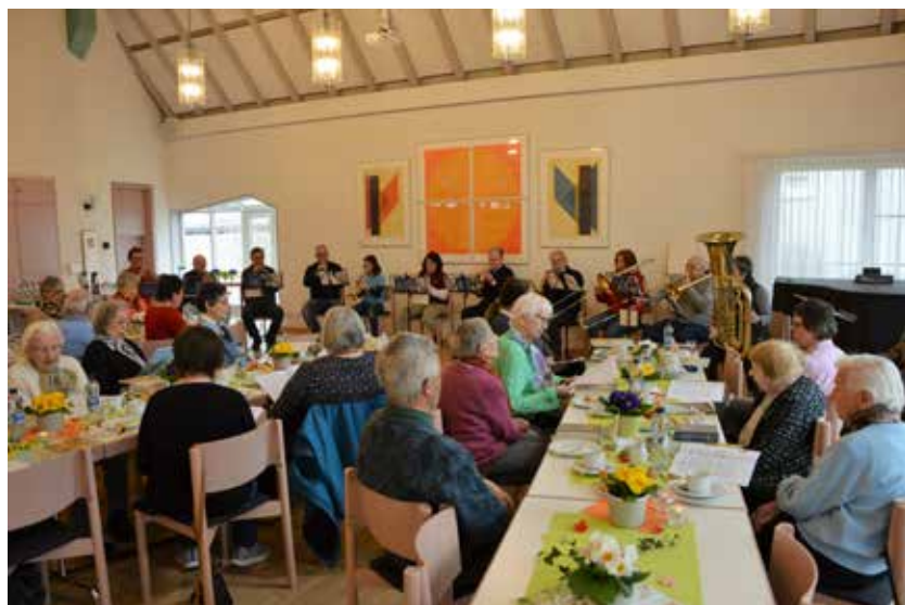
...und der Posaunenchor spielt dazu