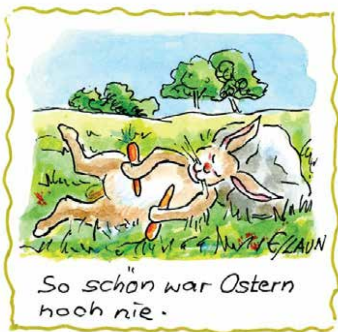
Die verschiedenen Motive