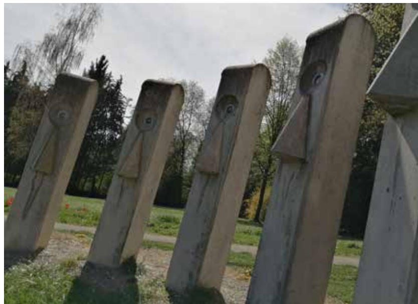
MarEl Schaefer, Sichtweisen

Anmeldung im Kulturamt Eningen unter 07121-8921250 oder unter ramona.mathes@eningen.de