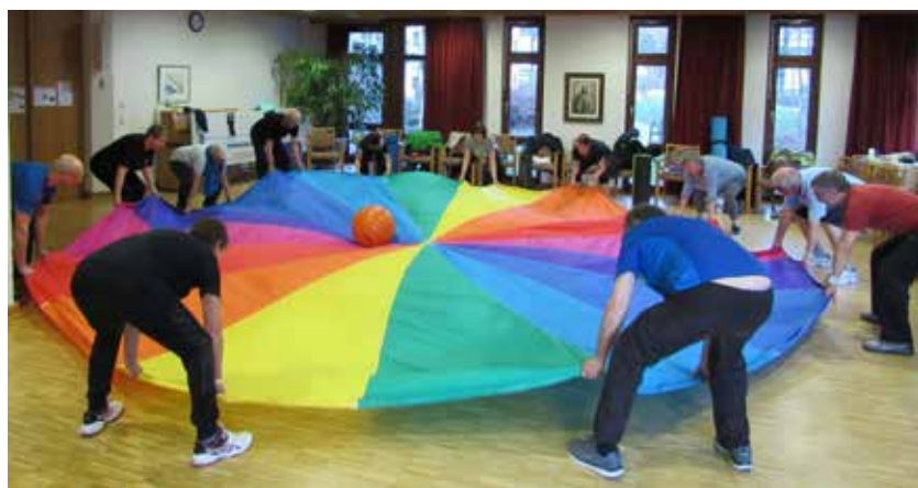
Übung mit Schwungtuch

Er findet immer Mittwochs von 10:30 Uhr – 11:30 Uhr in der Sporthalle des SKV Eningen, Geißbergstr. 36 in Eningen statt. Informationen gerne unter: 07121/ 1360723. Es ist ein AB geschaltet.