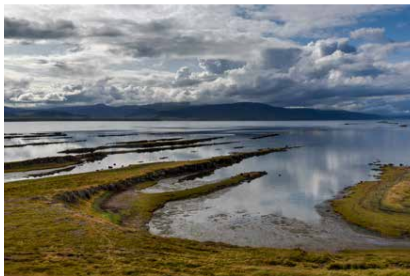
Der Krokksfjordur in den Westfjorden