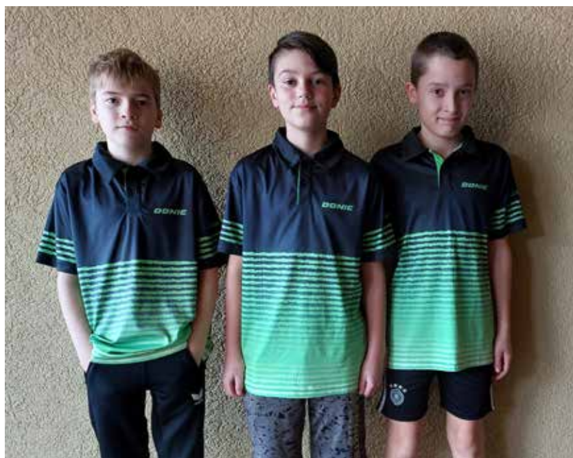
Die erfolgreiche U13 Mannschaft