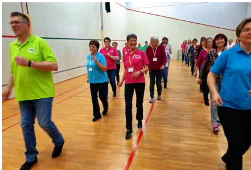
Das macht richtig Spaß und hält uns fit