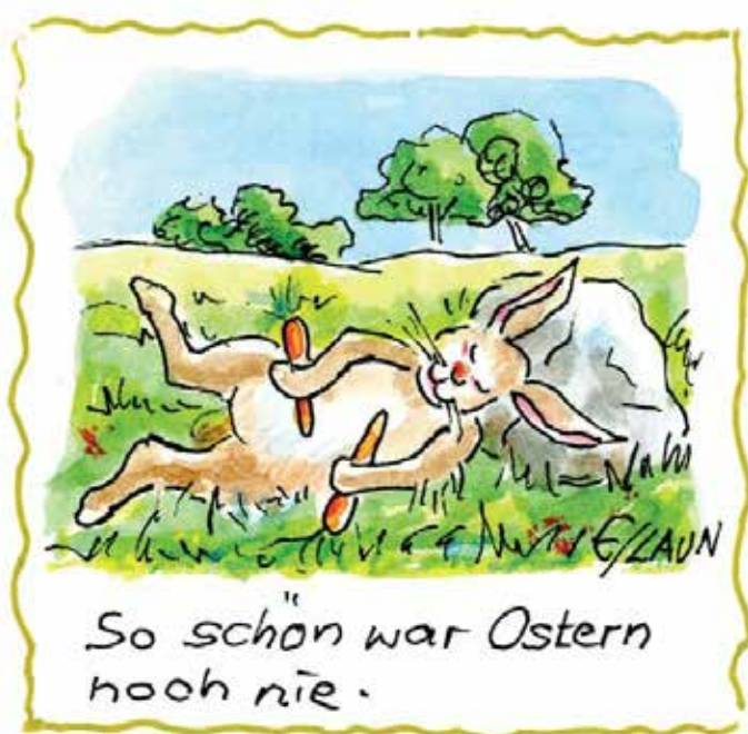
Die verschiedenen Motive