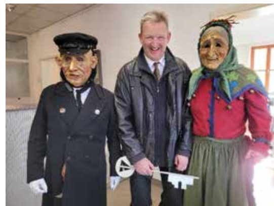
Der Schultes wird „entmachtet“!