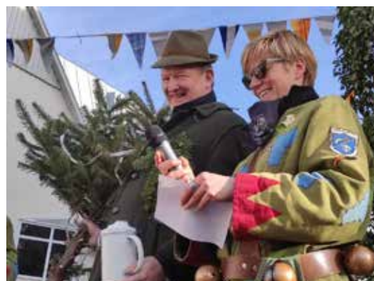
Fleißig sammeln musste der Schultes für die Weihnachtsbaumbeleuchtung....