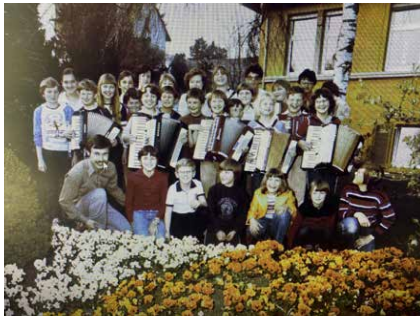
Das Akkordeonorchester - früher

Über viele Gäste freuen sich die beiden Initiatoren.