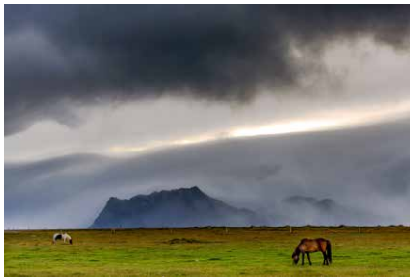
Herbst auf der Halbinsel Snæfellsnes