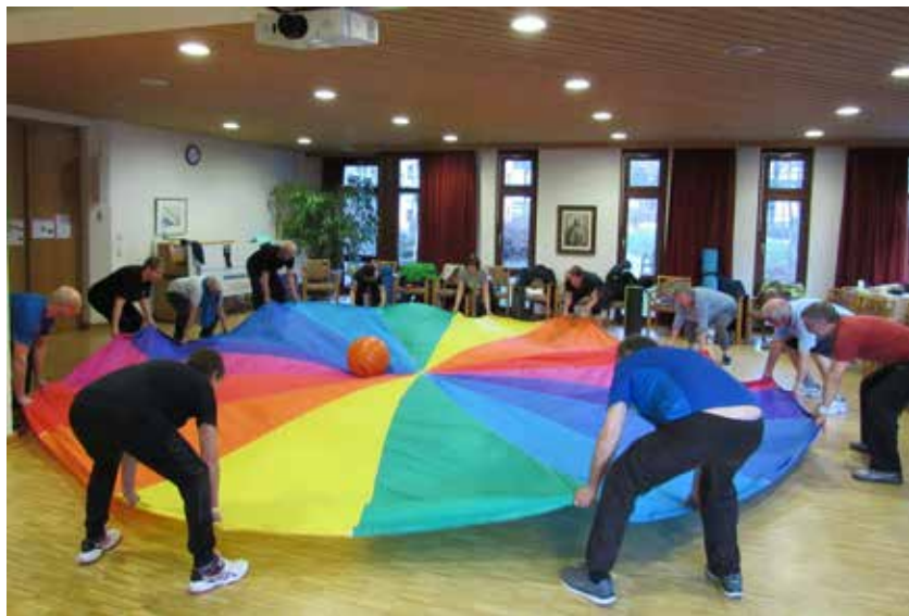
Übung mit Schwungtuch

Veranstaltungsort: Turnhalle des SKV Eningen, Geißbergstraße 36 in 72800 Eningen.