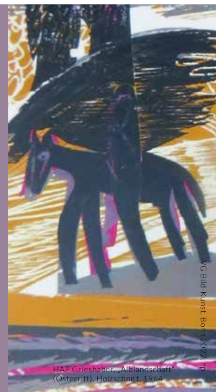
HAP Grieshaber, „Ablandschaft“ (Osterritt), Holzschnitt, 1964