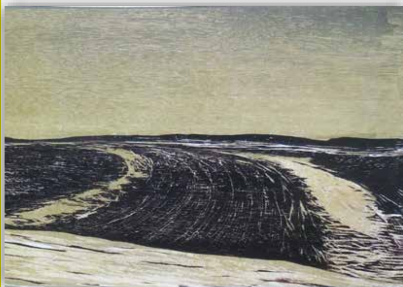
Klaus Herzer, Albhochfläche, Holzschnitt, 1983

Sonntag 5. März 2023 um 16.00 Uhr HAP-Grieshaber-Halle, Eningen unter Achalm Ausstellung geöffnet von 14-16h