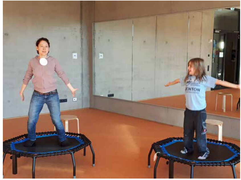
Ab 01.03.2023 ist der Spaß an Bewegung, neben des Ernährungsmodules, ein wichtiger Baustein im präventiven Ansatz des neuen Jumbo Fit Bewegungs-Modules.