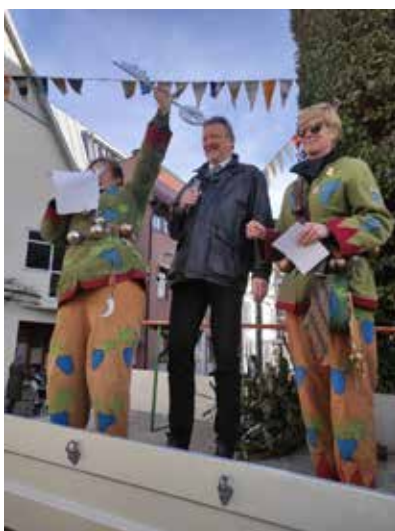
Das Rathaus ist fest in Narrenhand!