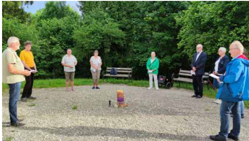
Friedensgebet im Sommer am "Türmle"