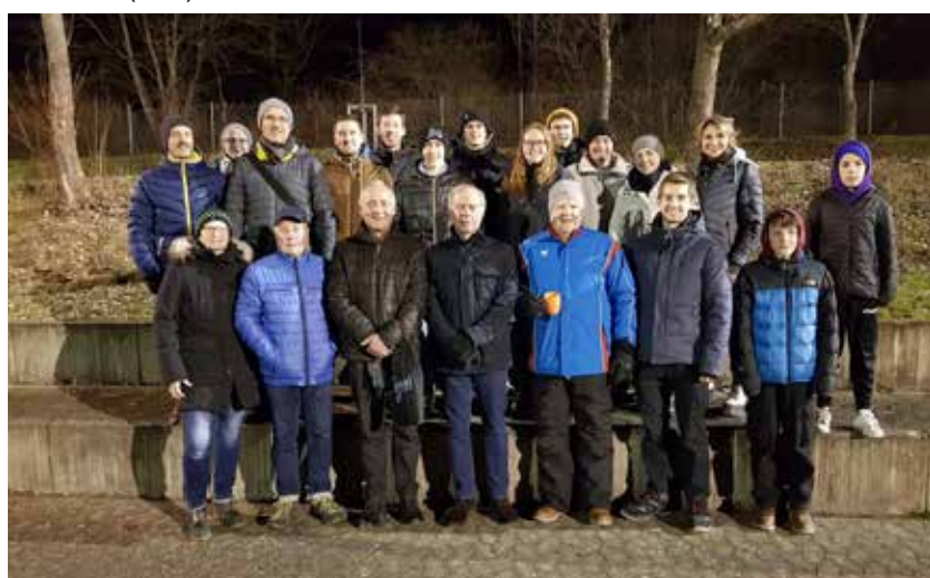
Die geehrten Athleten für ihre Leistungen beim Mehrkampf-Anzeichen und beim Sportabzeichen.