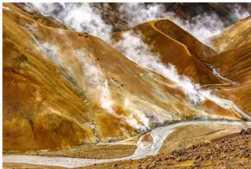
Heiße Quellen im Kerlingarfjöll, einer vulkanischen Gebirgskette