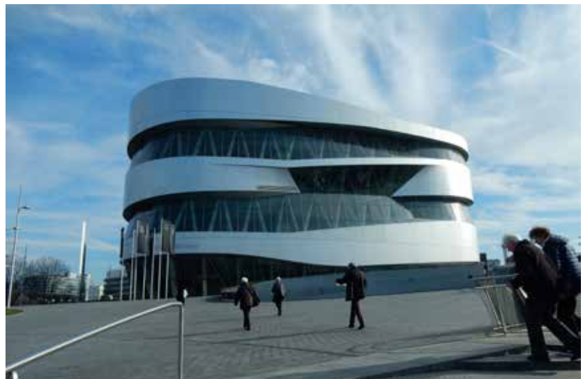
Das imposante Museumsgebäude