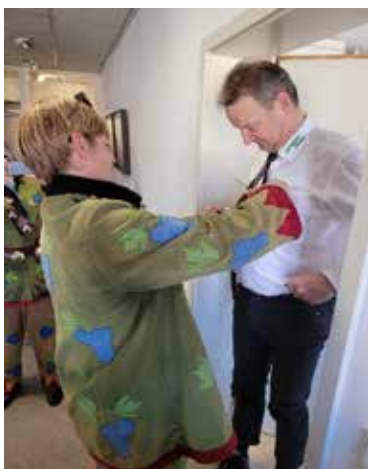
Schnipp-Schnapp - die Krawatte ist ab ....