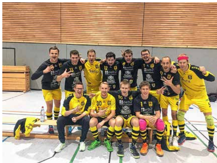
Die Herren 1 nach dem Auswärtserfolg gegen die TSG Tübingen