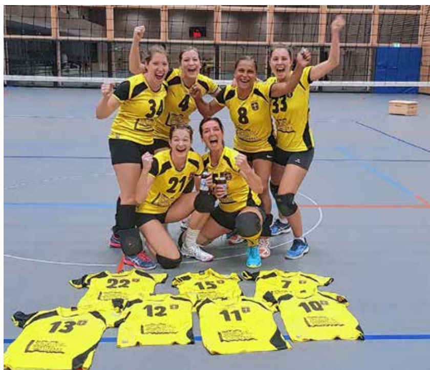
Die siegreichen Damen 1 gegen die SG Volley Alb

Zu sechst und damit in Minimalbesetzung sowie ohne Trainer Timo Kimmeler traten die Arbachtal-Schmetterlinge am Samstag, den 02.11.2019, den Weg auf die Alb nach Gerstetten/Dettingen an. Es herrschte eine lockere und äußerst unverkrampfte Stimmung, da man im Grunde nichts zu verlieren hatte. So gingen sie guten Mutes in den 1. Durchgang der Partie gegen die SG Volley Alb. Es zeigte sich ein Kopf an Kopf Rennen, bei dem die Eninger Damen am Ende durch Risikoaufschläge den Sack zumachen konnten. (26:24)