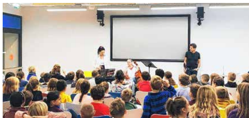
Die Lehrer stellen ihre Instrumente vor-die Schüler lauschen gespannt