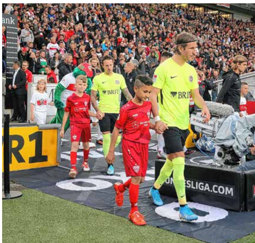
Der TSV-Fußball-Nachwuchs beim VfB Stuttgart als „Einlaufkinder“

Ein tolles Erlebnis hatten kürzlich 25 Jugendfußballer des TSV Eningen, denn sie durften bei einem Bundesligaspiel in der Mercedes-Benz-Arena nicht nur live dabei sein, sondern sie waren mit den Profis vom VfB Stuttgart und den Gästen sogar beim Einlaufen im Stadion in Aktion. Wenngleich auch im Endeffekt das Ergebnis nicht ganz wie erwartet für die Gastgeber ausfiel, so war die Aktion für den TSV-Fußball-Nachwuchs dennoch eine schöne und interessante Sache – auch als bleibende Erinnerung.