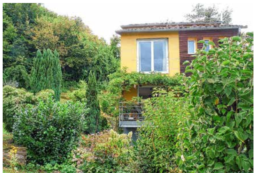
Einladung zum Vortrag zur Wohn- und Eigenheimsituation im Alter mit ausgewiesenen Fachexperten

www.facebook.com/ForumGesundeGemeinde www.ForumGesundeGemeinde.de