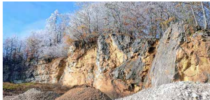
Felsenpartie im ehemaligen Steinbruch Renkenberg