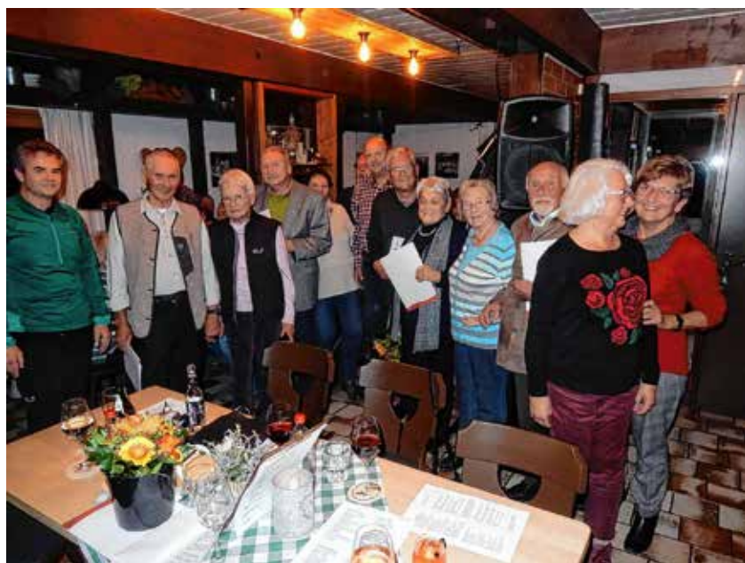
Die geehrten Mitglieder