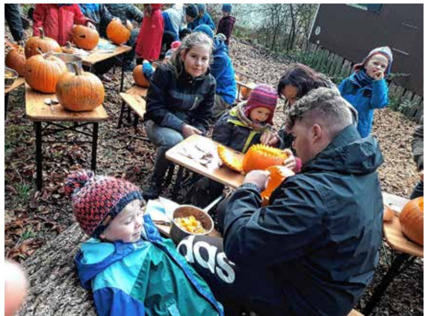
Schaurig-schöne Kürbisgeister entstehen.

Mit dem Lied von den Wichtelkindern im Winter ging der Vormittag zu Ende. Wir erlebten einen ereignisreichen, schönen Tag der Gemeinschaft und des Austausches und sind dankbar für die wertvolle Zeit miteinander. So verabschiedeten wir uns voneinander und freuen uns schon jetzt auf den nächsten Papatag!