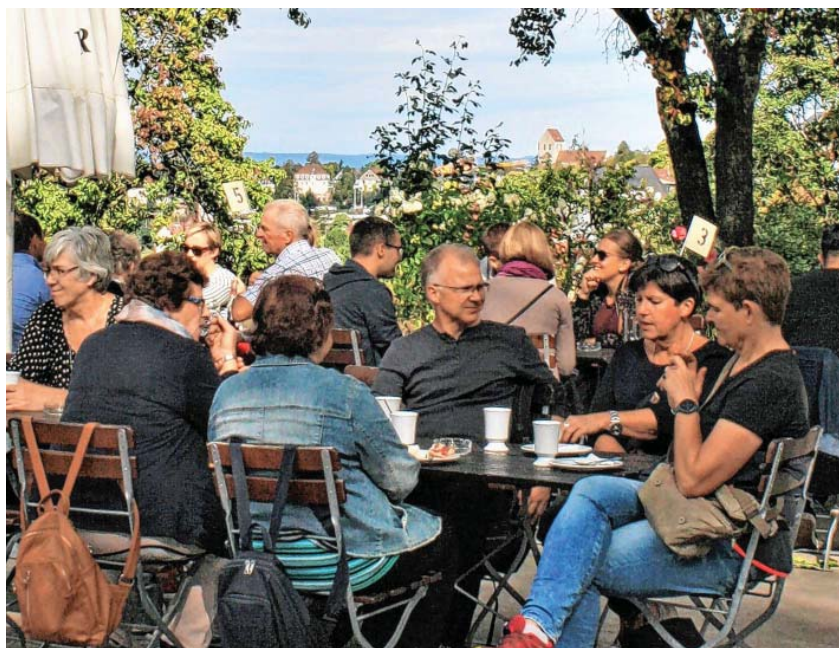
Gemeindeausflug der evangelischen Kirche

Dann trennten sich die Wege. Eine Gruppe nahm Waldwege und Stäffele, um ins Tal zu kommen, eine andere Tour erprobte die Zahnradbahn und die Seilbahn, während eine weitere Gruppe sich auf biblische Spuren begab und das relativ neue Bibelmuseum in Stuttgart besuchte.