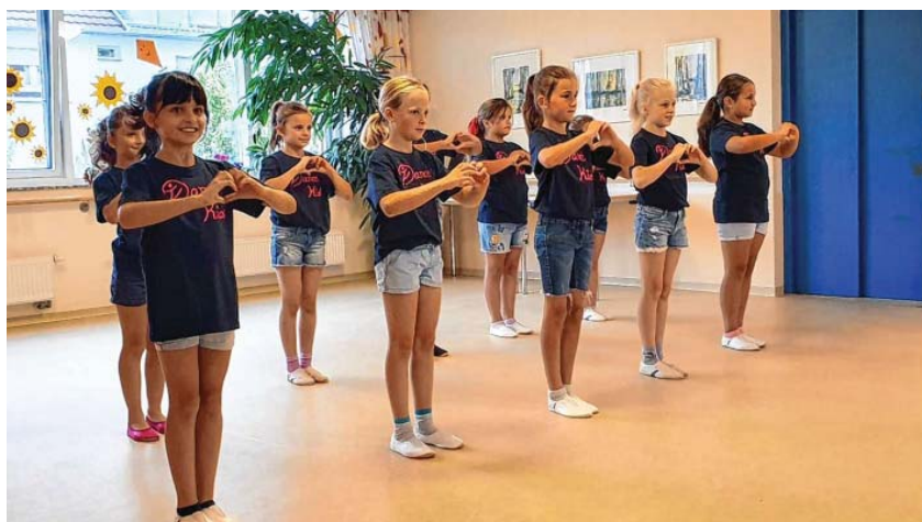
Dance Kids Gruppe 1

Am 26. September 2019 hatten wir (Dance Kids und Malimico) einen Auftritt im Frère Roger.