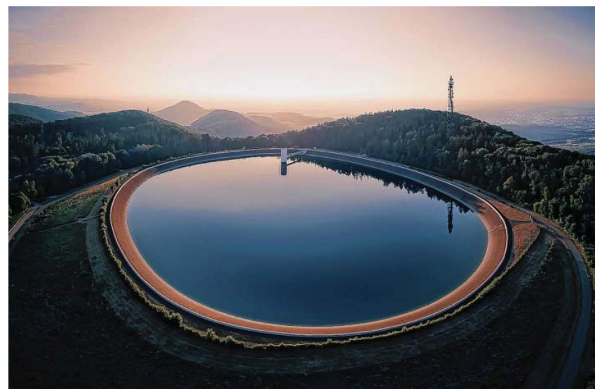
Gewinnerbild: Philipp Sautter