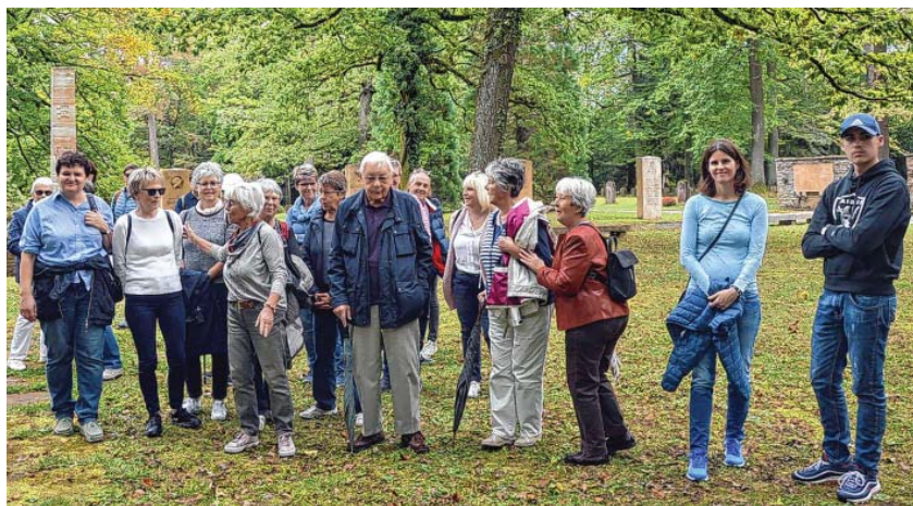
Auf dem Waldfriedhof in Stuttgart