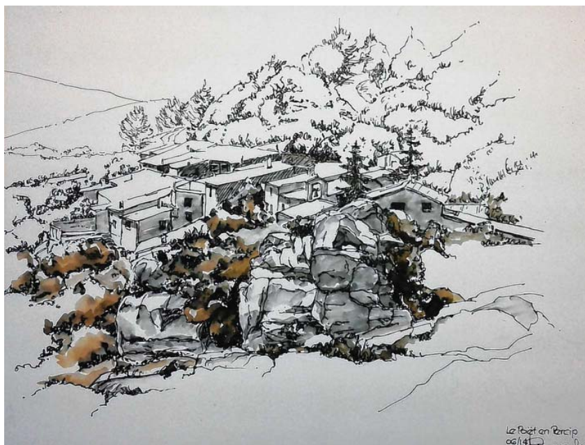
„Landschaft bei Reicheneck“, Rohrfeder farbig laviert (2018)