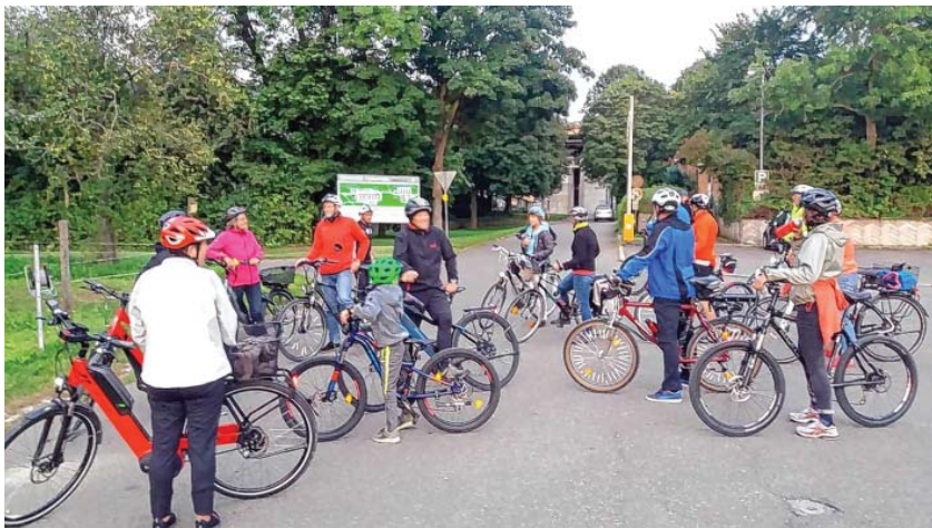
Ausreichend Pausen für alle Teilnehmer. Die Tradition der ‚fröhlichen‘ Radtour soll nächstes Jahr weiter gehen.