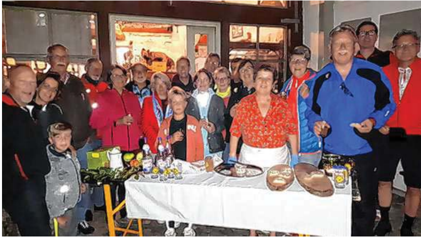
20 hochmotivierte Freizeitradler bei der fröhlichen Radtour des AK Gesunde Gemeinde. Hier beim Imbiss des Erikales am Heimatmuseum.