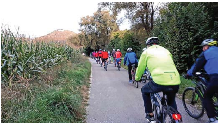
Eninger Radfahrer aller Altersstufen im Arbachtal mit Ulrich Wüsteney des AK Gesunde Gemeinde unterwegs