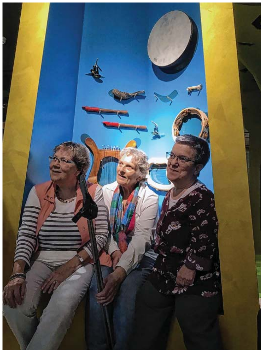
Gespannte Aufmerksamkeit im Bibelmuseum