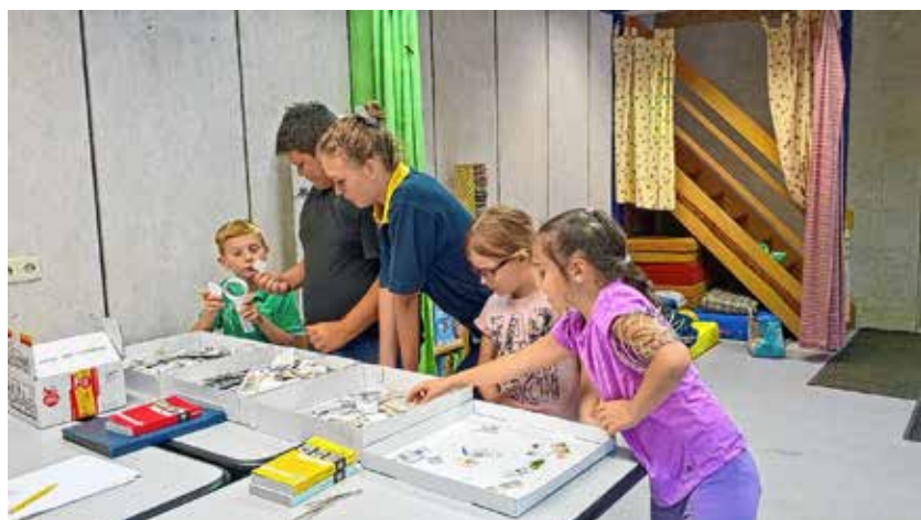
Entdeckungstour durch die bunten Schätze aus Papier

Das Briefmarkensammeln ist eben immer noch eine spannende Sache. Es zeigt sich einmal mehr, dass dieses schöne Hobby trotz zahlreicher weiterer Verlockungen nach wie vor eine faszinierende Freizeitbeschäftigung sein kann. Eninger Junge Philatelisten e. V.