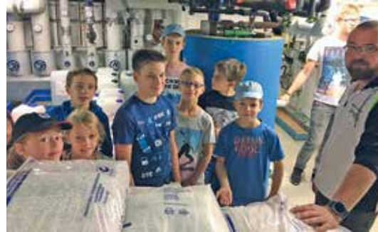
„Unser Freibad von unten“

Auch die Jugendfußball-Abteilung des TSV Eningen führte in dieser Woche mit externer Begleitung ein Fußball-Sommercamp durch, welches trotz wechselhaftem Wetter mit knapp 100 Teilnehmerinnen und Teilnehmern großartige Resonanz fand. Unser Dank gilt deshalb all denjenigen, die ihre eigene Freizeit oder gar eigene Ferientage für solche Aktivitäten bereitstellen, als Betreuer mithelfen oder in irgendeiner Form zum Gelingen solcher Angebote beitragen. Herzlichen Dank hierfür !!!