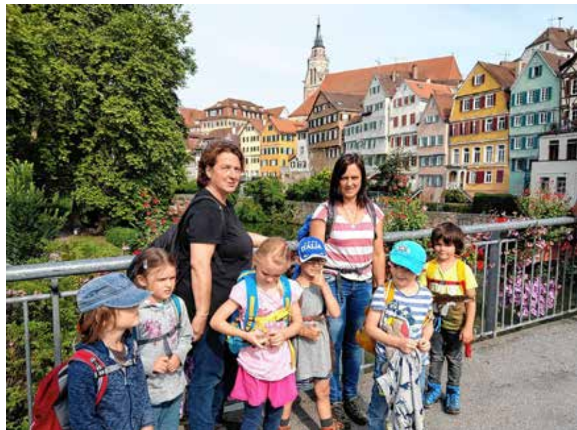
Die Waldwichtel-Vorschüler beim Ausflug nach Tübingen auf der Neckarbrücke.

Das Kindergartenjahr im Wichtelwald neigte sich dem Ende zu und damit auch die Zeit der Vorschulkinder im Waldkindergarten, die dies mit tollen Aktivitäten vollenden durften.