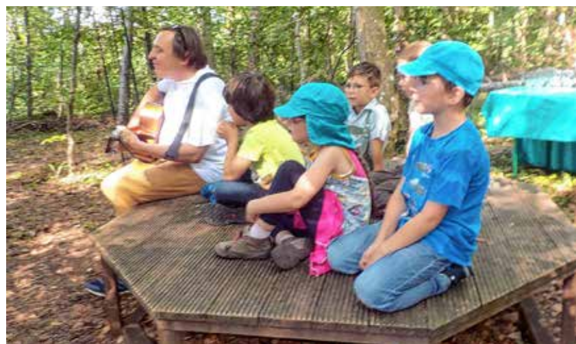
Musikalische Einlage bei der Vorschulverabschiedung.

Zum Schluss wurde jedes Vorschulkind noch von uns mit dem „Schi-Scha-Schaukel-Spiel“ traditionell geschaukelt und schließlich streuten die anderen Waldwichtel kleine Glücksherzchen und Marienkäfer auf die Vorschüler, die diese eifrig aufsammelten und den kleinen Schatz in ihrem selbstgemachten Mäppchen sorgfältig verstauen.