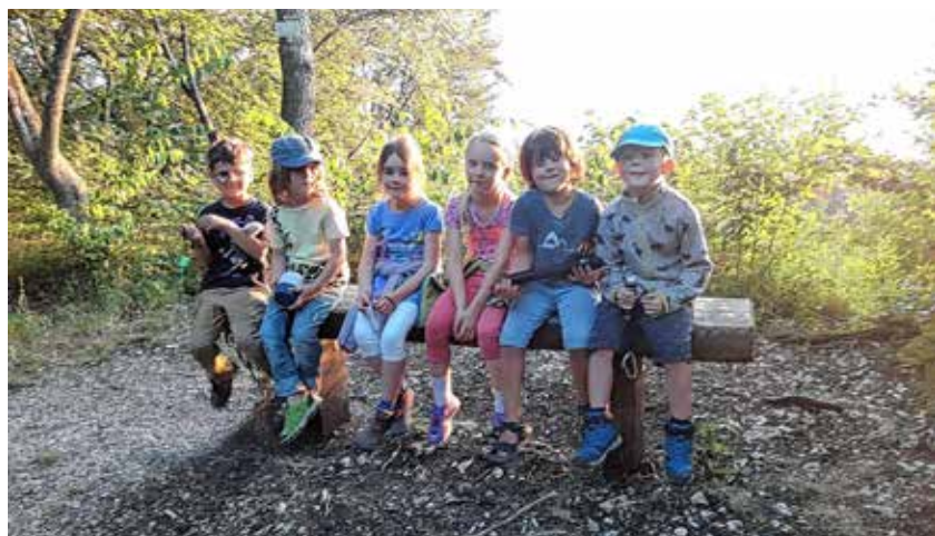
Die Vorschulwichtel auf Schatzsuche bei der Vorschulübernachtung

Müde und erfüllt starteten wir schließlich zum Tübinger Bahnhof, wo wir mit dem Zug zurück nach Reutlingen fuhren. Auf der Zugfahrt tauschten wir unsere schönen Erlebnisse des Tages aus und kamen schließlich voller schöner Eindrücke und Erinnerungen zu Hause an.