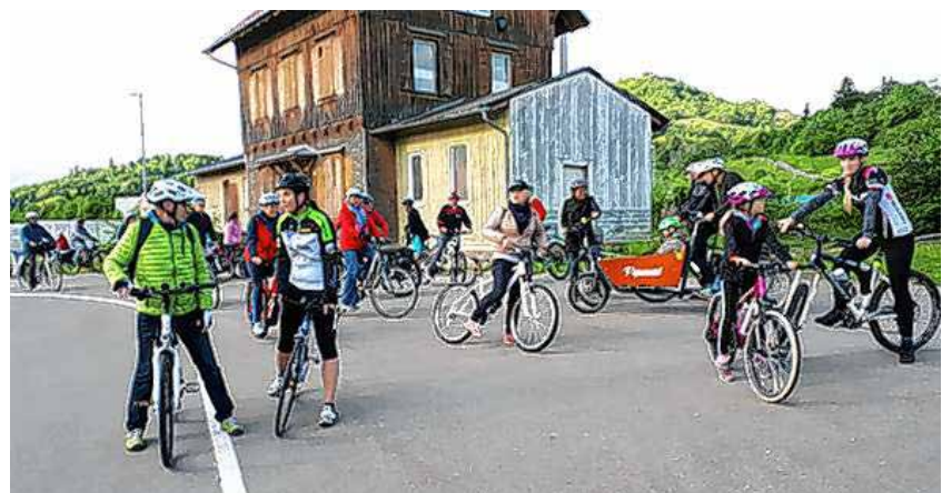
Die fröhliche Radtour der Projektgruppe Bewegung des AK Gesunde Gemeinde war ein voller Erfolg