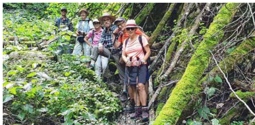
Über Stock und Stein