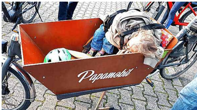
Die Teilnehmer von jung bis alt bewegten sich aktiv oder entspannten sich bei der angenehmen Radtour des AK Gesunde Gemeinde