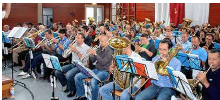
Posaunenchorbläser beim Bezirksposaunentag

Es ergeht eine herzliche Einladung zu diesem besonderen Gottesdienst.