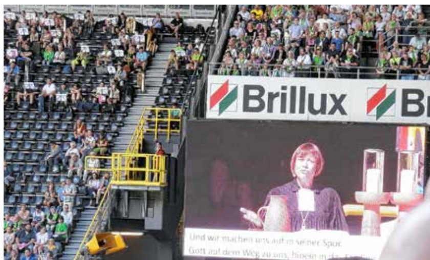
Abschlussgottesdienst des Deutschen Evang. Kirchentags