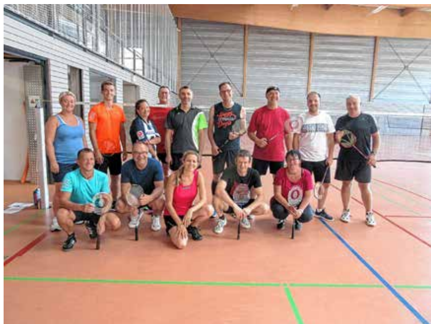
Die Teilnehmer des badminton-Turniers

Euer Team der Skiabteilung des TSV Eningen u.A. e.V.