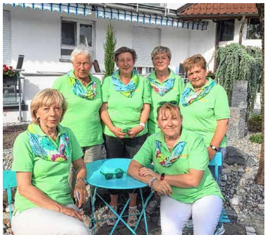
Wie immer gut gelaunt : das Sextett der TSV-Turnerfrauen bei ihrer gelungenen Tour am Bodensee.

Alle schwärmten in der Nachbetrachtung von wieder wunderschönen harmonischen Tagen - und sie freuen sich so schon auf den Ausflug im nächsten Jahr!!