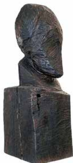
CHC Geiselhart“, Große Wächterbüste“

...so könnte man den „ePunkt“ am Eninger Rathaus umschreiben. Hier wechseln sich Themen, Formen, Techniken und Materialien genauso ab, wie sich auch die verschiedensten Künstler mit ihren unterschiedlichen Herangehensweisen an Themen abwechseln und austauschen.