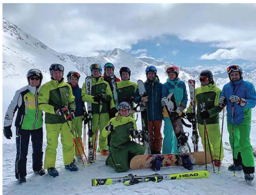
Grüße aus dem Stubaital

Euer Team der Skiabteilung des TSV Eningen