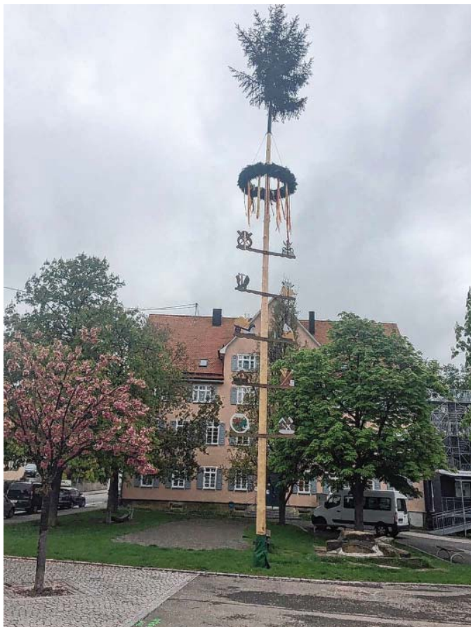
Der Maibaum steht