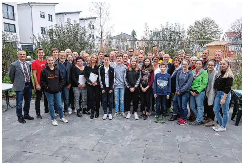
Die zahlreich Ausgezeichneten bei der TSV-Ehrungsfeier