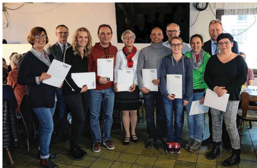
Geehrte der TSV-Turn-Abteilung