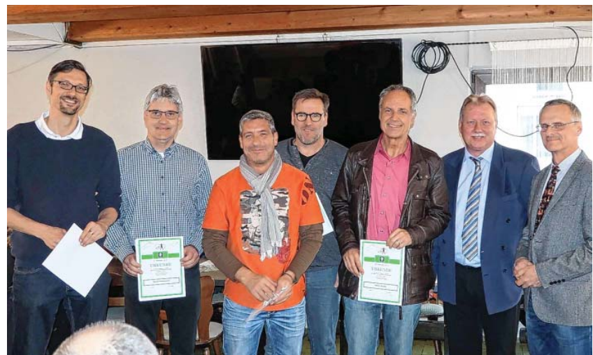
Ehrung für Volleyballer

Ist Ihre Hausnummer und Ihr Name gut erkennbar ? Bei der Zustellung von Post kann das entscheidend sein für eine ordnungsgemäße Zustellung. Dazu gehört auch die Beschriftung der Briefkästen.