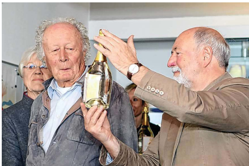
TVE-Vize übergibt den eigens kreierten TVE-Prosecco