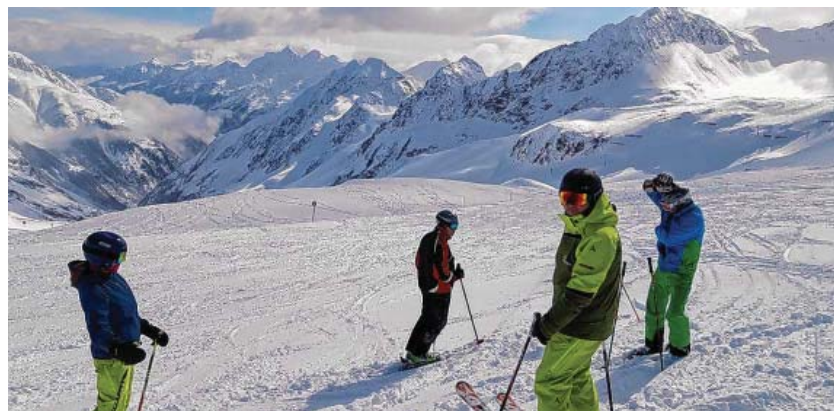
Juhuuu - Neuschnee!!