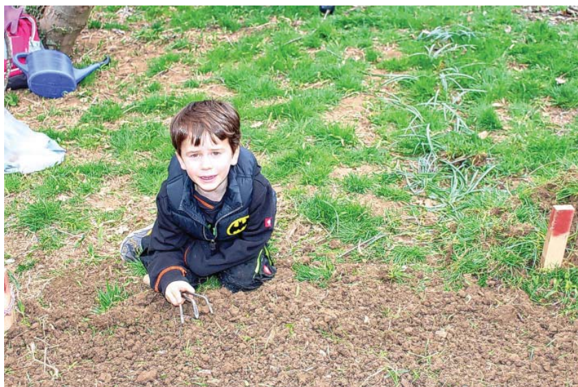
Die Arbeit ist vollbracht.