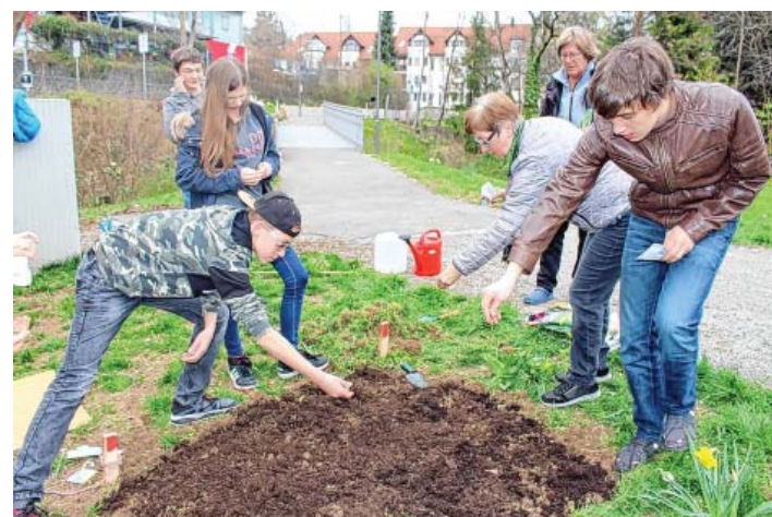
Einsäen der Wildblumen