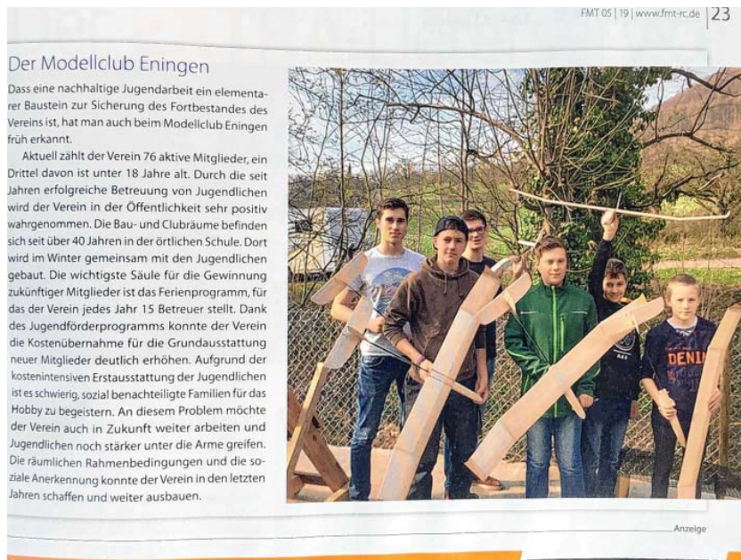
FMT Fachzeitung Mai 2019