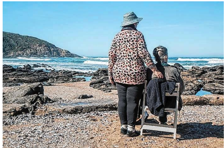
Vortrag am 09. Mai- Lernen Sie den Pflegestützpunkt und sein Eninger Angebot kennen