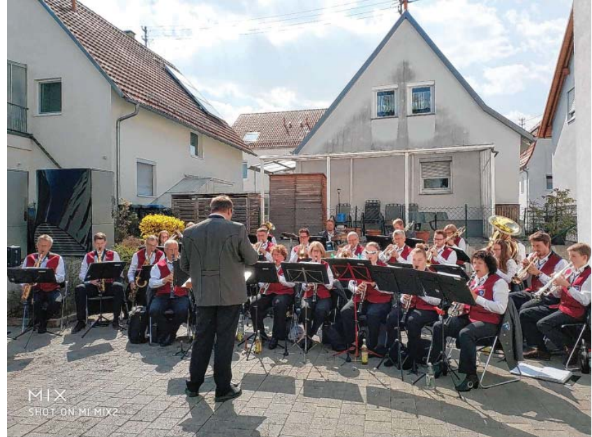
Der Musikverein Eningen bei Goldlauf am vergangenen Sonntag.