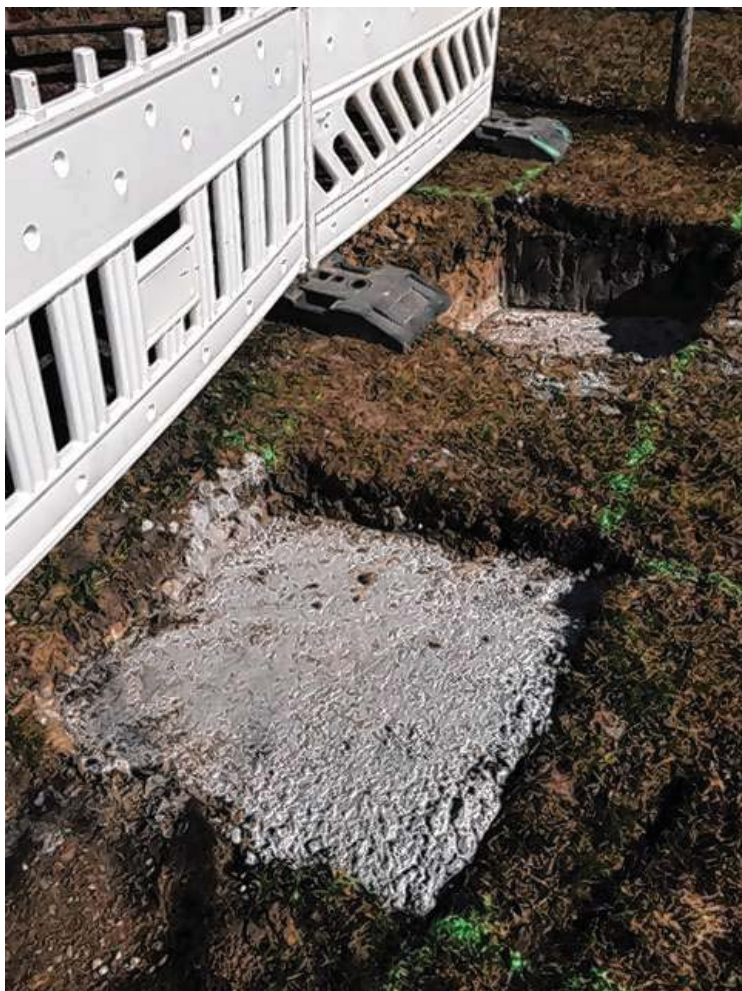
Die Fundamente sind vorbereitet

Der Förderverein plant weitere Repliken auf dem Rundweg aufzustellen, um an Beispielen das Werk und die Schaffensperioden des Künstlers aufzuzeigen. Ein Umtrunk wird das Ereignis abrunden. Da der Zufahrtsweg zur Schillerhöhe nicht für den allgemeinen Fahrverkehr zugelassen ist, wird in der Zeit von 14.30 Uhr bis 15 Uhr der Bürgerbus zwischen Bahnhofstraße 18 (Alter Straßenbahnhof) und Schiller Höhe pendeln. Die Fahrten sind kostenlos. Die Rückfahrt ist ab 16.30 Uhr geplant.