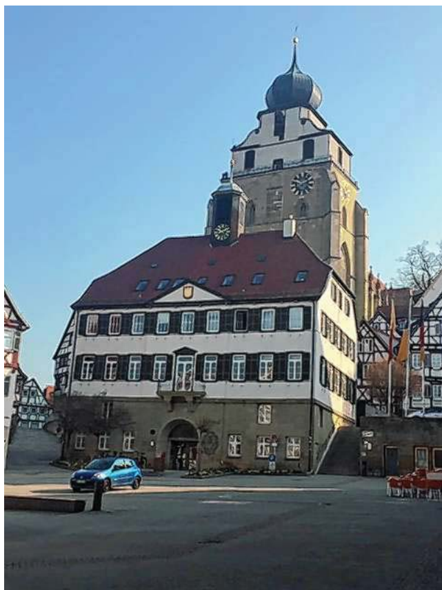
Das Rathaus und die Stiftskirche

Wir durchqueren die schöne, historische Altstadt und genießen den Ausblick auf das Gäu von der Terrasse der Stiftskirche (die Glucke vom Gäu) und der Burgruine aus. Ein schöner Weg führt durch Wiesen und Wald zum Naturfreundehaus und dann zum neuen und spektakulären Schönbuchturm, der weite Ausblicke ermöglicht