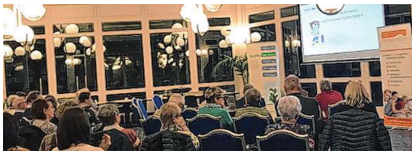
Fast 100 Zuschauer kamen zum interdisziplinären Vortragsabend des AK Gesunde Gemeinde in Kooperation mit dem Gesundheitsforum ins Nazar Eventhouse in Eningen