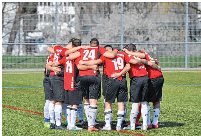
Starke Teamleistung des SKV Eningen

Mit diesem Ergebnis setzen die „Roten“ vom SKV ihren Aufwärtstrend fort. Nach der Winterpause holte man mit diesem Achtungserfolg nun 7 Punkte aus 3 Spielen.