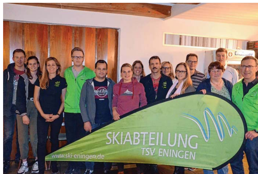
Das Team der TSV-Ski-Abteilung