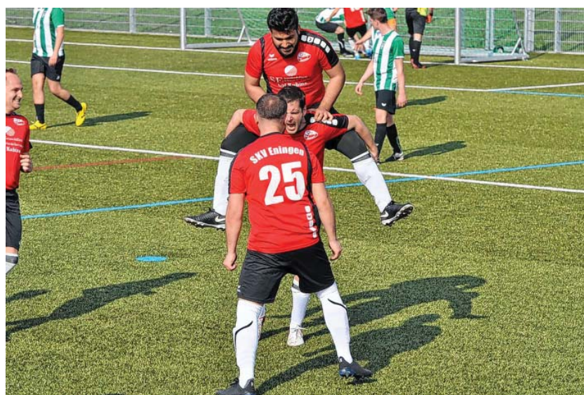
Erleichterung und Freude nach dem 2:2 Ausgleichstreffer