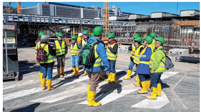
Sicherheit wird hier großgeschrieben

Die Eninger Naturfreunde waren begeistert von der Großbaustelle und von der Logistik die hinter dem ganzen Projekt steckt. Die Fertigstellung ist für das Jahr 2025 vorgesehen, Baukosten Stand heute 8,2 Milliarden Euro . Alle oberirdischen bisherigen Bahnanlagen im Stuttgarter Zentrum können abgebaut, die frei werdenden Flächen von ca. 100 Hektar der Stadtentwicklung zur Verfügung gestellt werden. Tief beeindruckt, zurück auf dem Eninger Naturfreundehaus, wurden die neu erhaltene Erkenntnisse in geselliger Runde noch angeregt diskutiert.