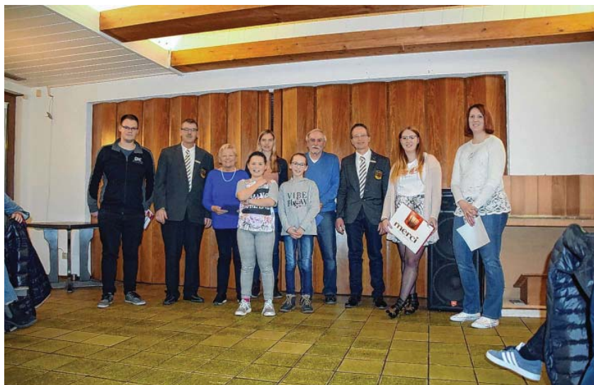
Vorstand mit langjährigen Mitgliedern und beste Wachgänger

Beim anschließenden Essen konnte man sich noch zu dem einen oder anderem Thema austauschen.