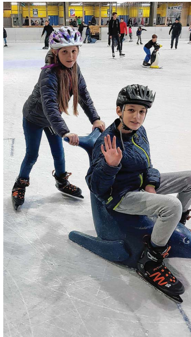
Man kann sich auch schieben lassen