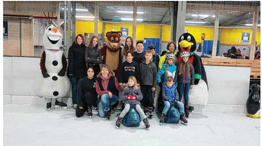
Gruppenfoto mit den Maskottchen der Eishalle

Einige hatten wohl am nächsten Tag noch etwas von unseren Jugendnachmittag – den Muskelkater!! Wir freuen uns schon auf unser nächstes Treffen am Samstag 13.04.19 zu unserem alljährlichen Osterbasteln.