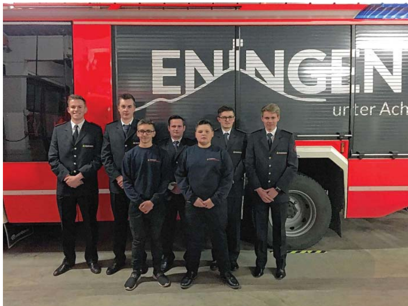
Gruppenbild der neuen Jugendfeuerwehrlfhrung