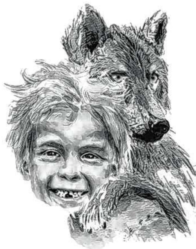
„Keram mit Wolf“

Anmeldungen erbittern wir telefonisch bei Busreisen Vöhringer Telefon: 07129 4137