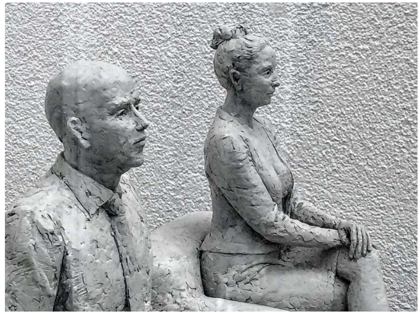
auch im Kunstraum in der Eugenstraße sind Werke der Künstlerin ausgestellt