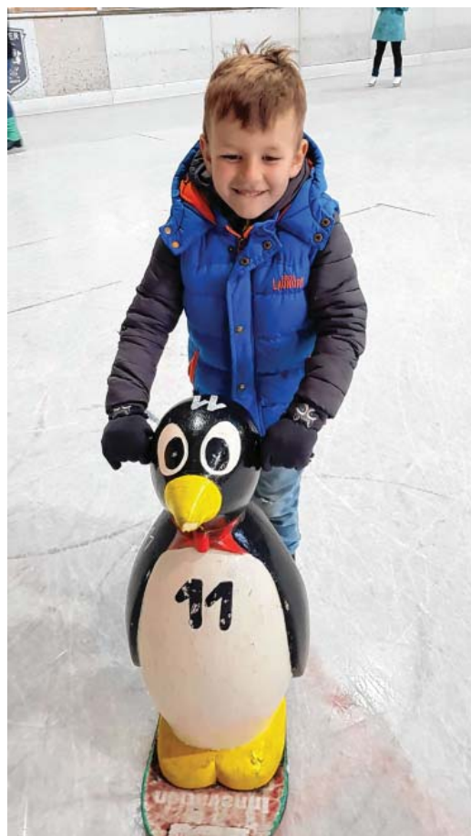
Auch die Jüngsten hatten ihren Spaß