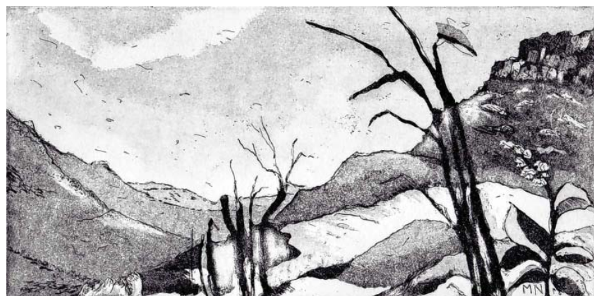
Marlene Neumann - Alplandschaft (2018)

Herzliche Einladung zur Vernissage Marlene Neumann - „Bleibende Eindrücke“ Freitag, 5. April um 18:30 Uhr im Paul-Jauch-Haus