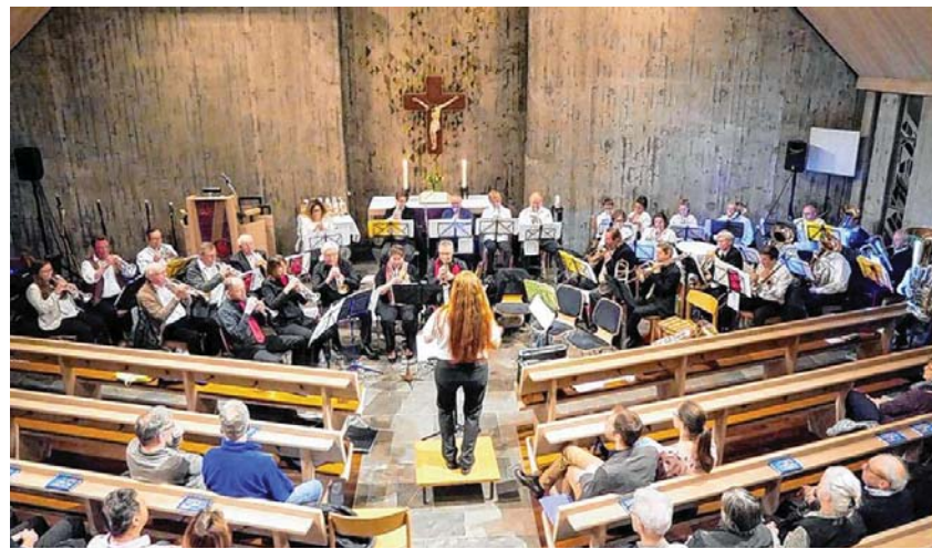
Die Posaunenchor Gebersheim und Eningen