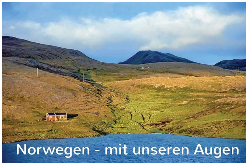
Norwegen - mit unseren Augen

Die Veranstaltung findet am Freitag, 29. März um 19:00 Uhr in der Aula der Achalmschule Eningen, statt.