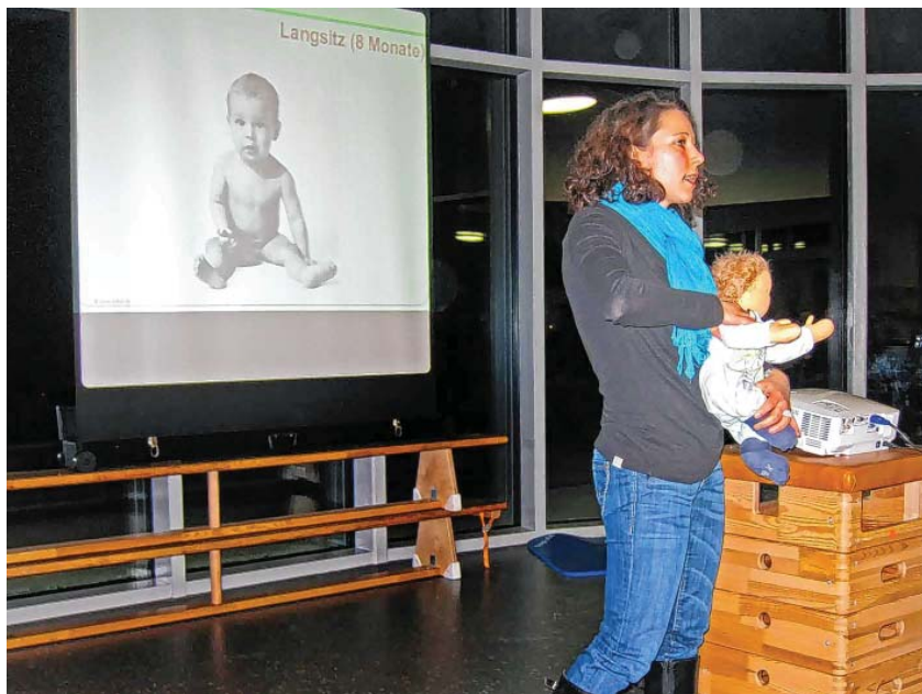
Das Gesundheitsforum begrüßt Sie gerne am 24. Januar im Johanneskindergarten