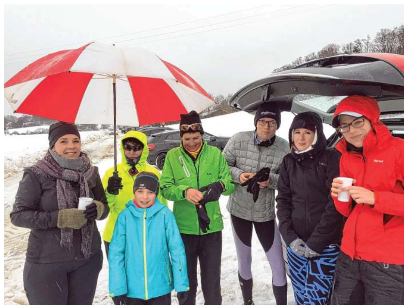
Zufriedene Teilnehmer nach dem Kurs!