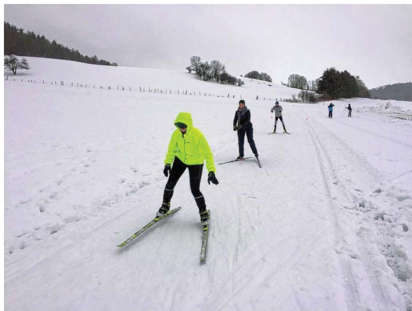
Sportlich unterwegs beim Langlaufkurs