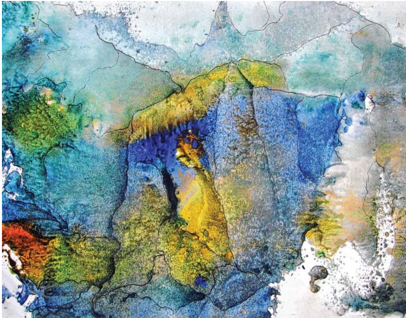
Minny Beckmann - Klingsors Zauberberg

Paul-Jauch-Haus Eitlinger Str. 5, Eningen unter Achalm Eintritt frei. www.paul-jauch-haus.de