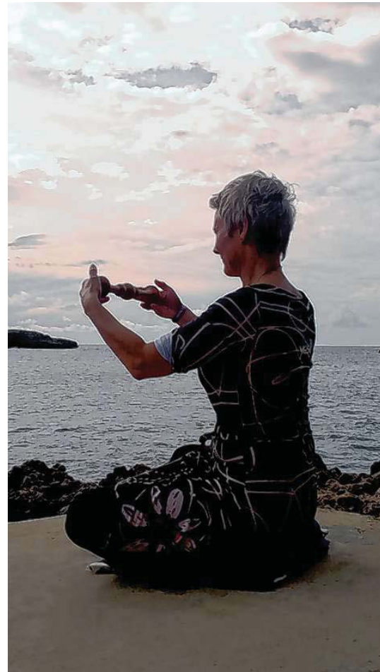
Achtsam mit sich umgehen- Daheim unter freiem Himmel oder vielleicht mal auf Wangerooge oder gar Malta?

Tel. 07121-98099-11; Fax -19 | info@APROS-Consulting.com