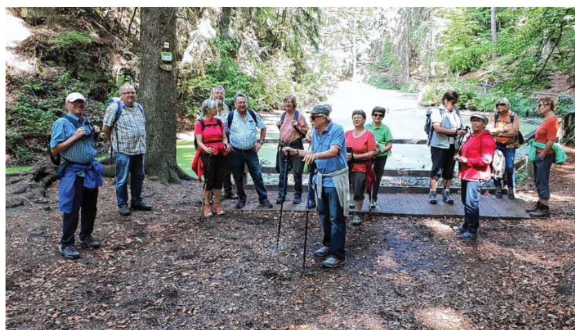
Eninger Naturfreunde am Märchensee