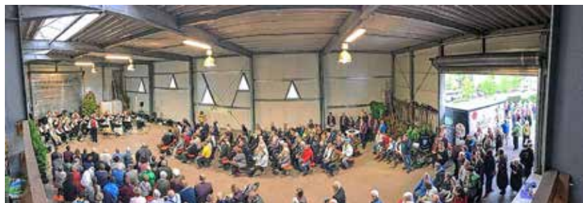
Die gut gefüllte Halle der Baumschule Rall beim Doppelkonzert