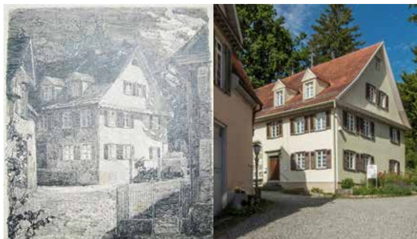
Zeichnung Paul Jauch

Die Ausstellung „Zeichnung und Fotografie“ wird an diesem Sonntag von 14 - 17 Uhr das letzte Mal zu sehen sein.