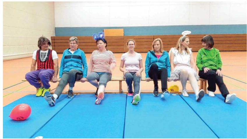
alle haben Spaß