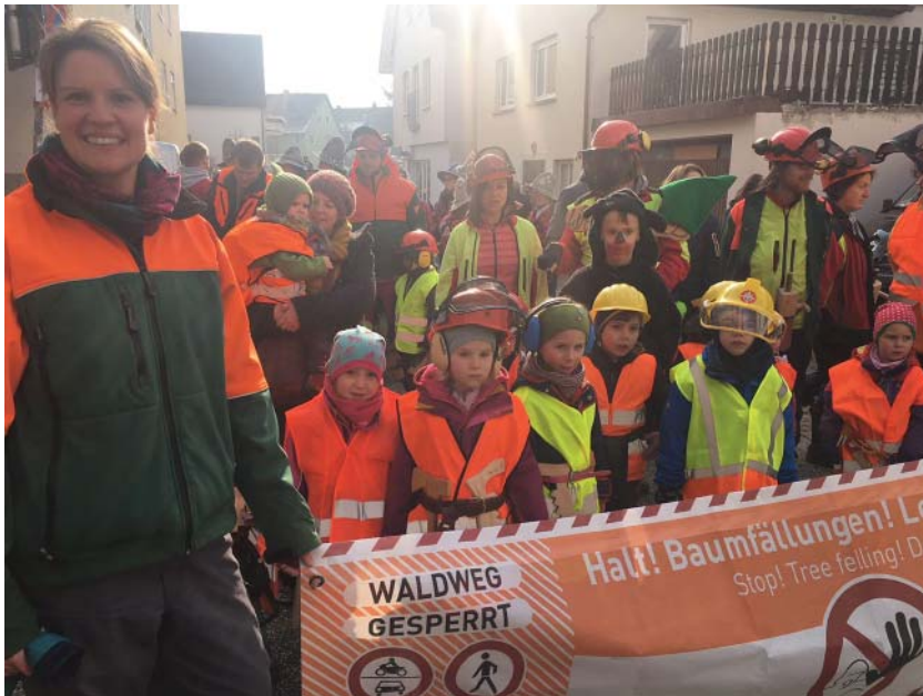
In diesem Jahr sind die Waldwichtel als tatkräftige Waldarbeiter beim Kinderumzug mit dabei.

Im Anschluss trafen sich die Waldwichtel wie jedes Jahr am Spielplatz im „Ei“ zum gemütlichen Ausklang bei Fasnetsküchle und Brezeln.