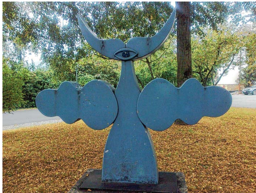
Die „Eichenläubin“ auf dem Schillerplatz, ein Beispiel für das Werk von Gudrun Krüger