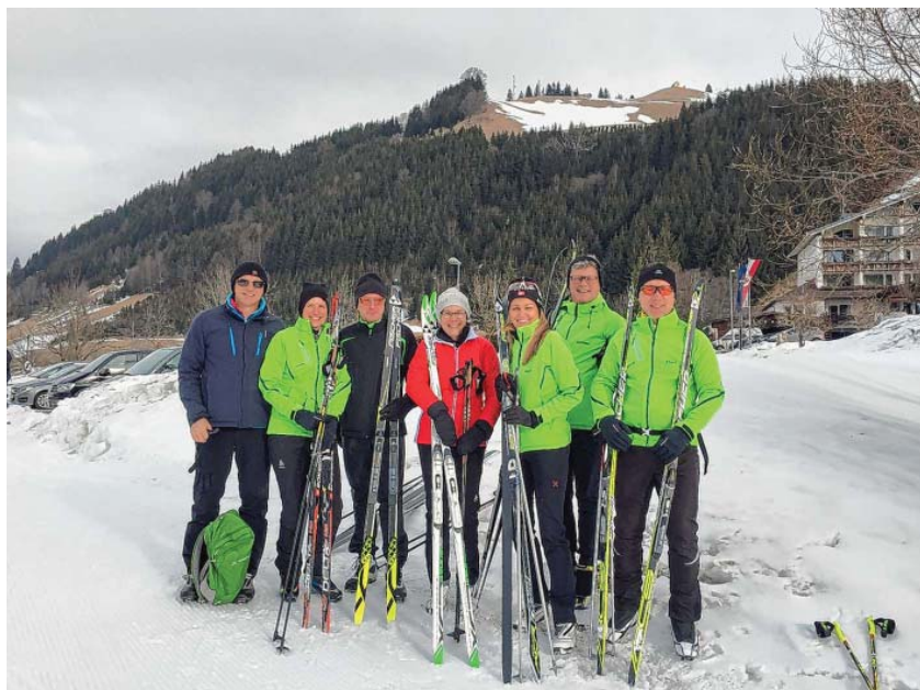
Tolle Langlaufbedingungen im Tannheimer Tal am letzten Sonntag

Tolle Langlaufbedingungen gab es am letzten Sonntag bei der spontanen Ausfahrt der Nordic-Abteilung im Tannheimer Tal. Die Loipen, sowohl klassisch als auch für Skating, waren bestens präpariert. Die Sonne zeigte sich immer wieder und das schon traditionelle Mittagessen beim Lenzer-Bauer war wie immer lecker. Und Anfang März geht es ein ganzes Wochenende in dieses Langlauf-Eldorado.