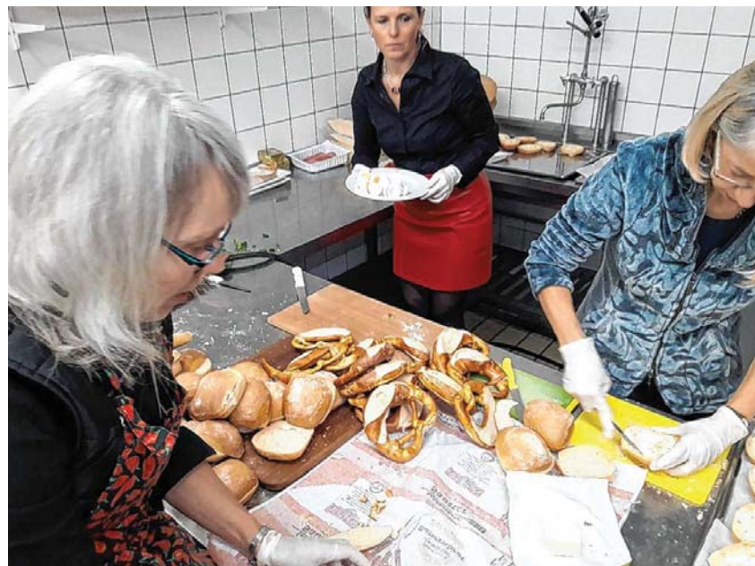
Die Turnabteilungs-Mannschaft bei der Vorbereitung