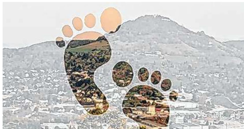
3. März von Fuß bis Kopf - Interessante Infos des Gesundheitsforums für jeden etwas dabei

Wir freuen uns auf die interdisziplinäre Veranstaltung mit verschiedenen Referenten