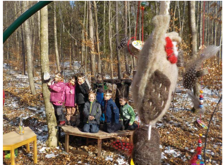
Zu weisen Eulen verwandelt landen die Vorschüler auf ihrem Podest.