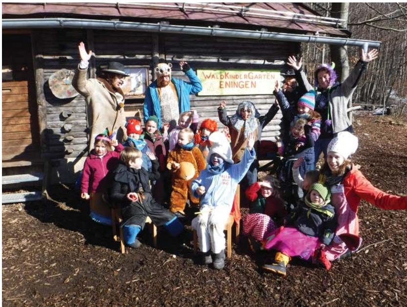
Vom Waldkindergarten-Fasching im Winter-Sonnenschein grüßt eine fröhlich-bunte Schar.

Zu bekannten Faschingsliedern wie „Trat ich heute vor die Türe“, Partyliedern wie „Komm hol das Lasso raus...“ oder „Da hat das rote Pferd“ wurde getanzt und gespielt. Nach dem Vesper in der bunt dekorierten Hütte, vergnügten sich die Waldwichtel bei strahlender Wintersonne bei Spielen wie das beliebte Würstchenschnappen, das Apfel-Fischen oder auch die Reise nach Jerusalem. Und egal ob Fee, Indianerin, Prinzessin, Rotkäppchen, Pippi Langstrumpf, Frosch, Hase, Affe, Erdmännchen, Monster, Cowboy, Schäfer, Schlumpf oder Kylo Ren von Starwars – alle machten fröhlich mit und beendeten damit die diesjährige Fasnetszeit ausgelassen und mit viel Spaß im Wichtelwald.