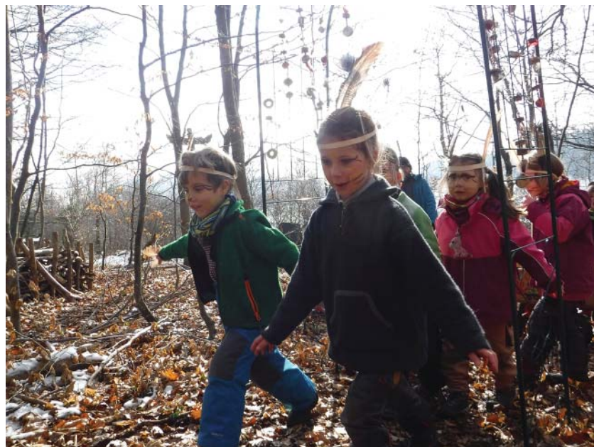
Die Vorschul-Eulen fliegen durch das Eulentor.

Bereits im Morgenkreis wurde das Eulenlied gemeinsam gesungen, bevor sich die Vorschulkinder für ihre Verwandlung in den Bauwagen zurückzogen. Dort herrschte rege Geschäftigkeit. So mancher Waldwichtel versuchte vergeblich einen Blick in den Bauwagen zu erhaschen um zu sehen, was da im Geheimen vor sich geht. Als sich dann endlich die Tür des Bauwagens öffnete, kamen imposante „Eulen“ aus dem Bauwagen „geflogen“. Sie hatten toll geschminkte Eulengesichter und waren mit langen Federn herausgeputzt. Die anderen Waldwichtel waren sehr beeindruckt. Begleitet vom Trommelklang und einem Lied wurden die Vorschuleulen dann im Bollerwagen ganz komfortabel zum Eulentor gebracht. Dort durften sie durch das festlich geschmückte Eulentor auf ihr Podest „hochfliegen“. Dort oben im „Eulennest“ gab es dann noch einen Verwandlungs-Zaubertrunk, der die Vorschuleulen vollends in weise, kluge Eulen verwandelte. Ein von einer Vorschulmama extra gebackener Eulenkuchen wurde mit allen Waldwichteln redlich geteilt und alle ließen es sich gut schmecken. Am nächsten Tag ging die Eulenfeier weiter. Da gab es noch den „Heimlichkeitenkoffer“ für die Vorschuleulen, eine Eulengeschichte wurde erzählt, Eulenkese wurden geknabbert und vor allem bekam jedes Eulen-Vorschulkind noch eine Halskette mit einem getonten Eulenanhängler geschenkt. Diese Eulenanhängler dürfen die Vorschüler fortan mit großem Stolz als Erkennungszeichen umhängen.