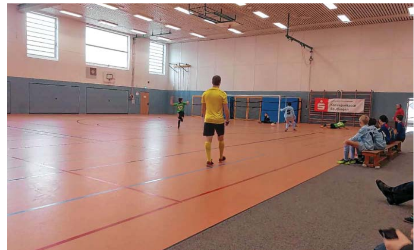
Luki pfeift bei der D Jugend