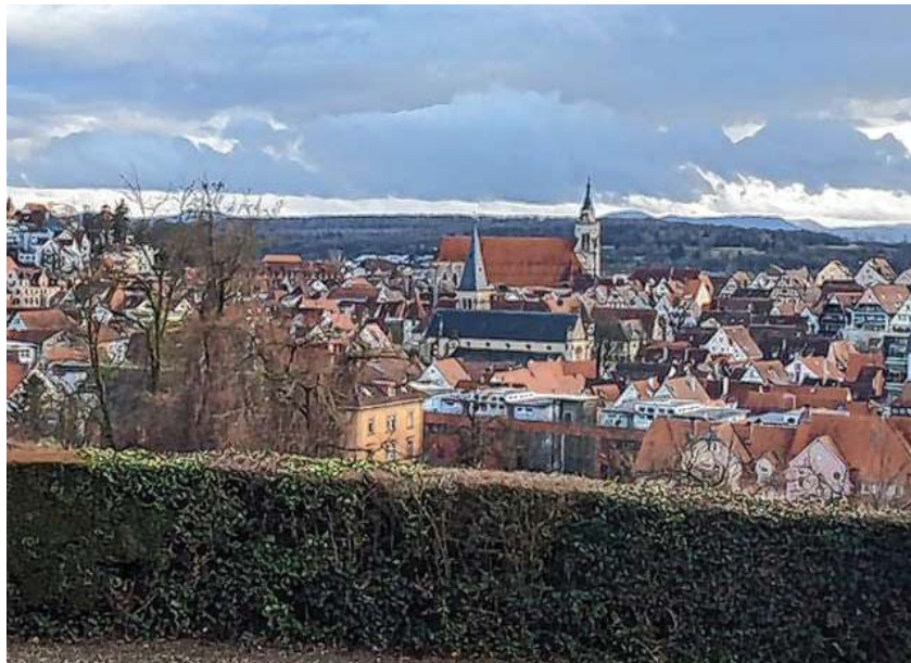
Blick auf die Altstadt und die Schwäbische Alb