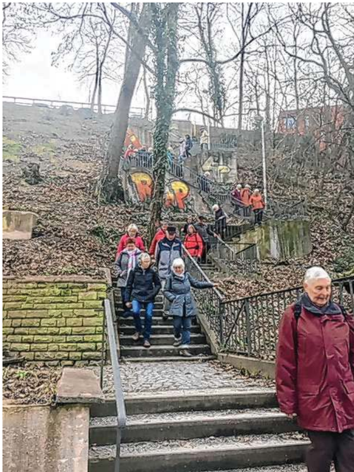
Auf der Himmelsleiter