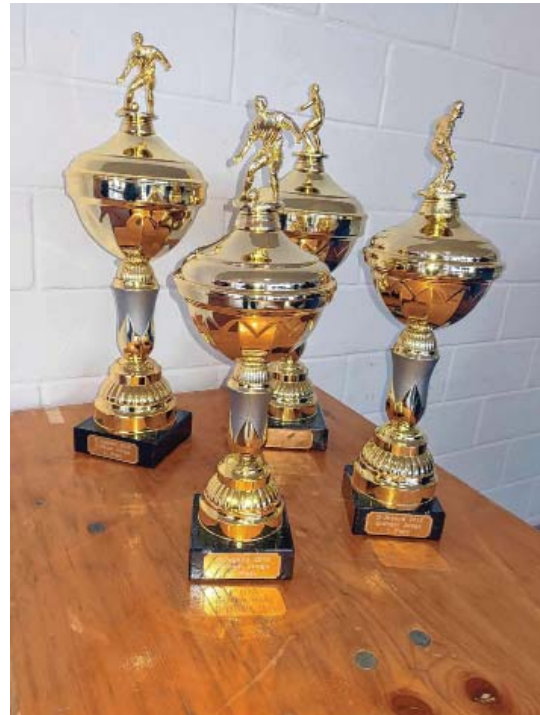
Pokale für die F Jugend