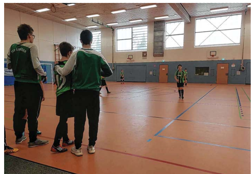
Die D Jugend Coaches in Aktion