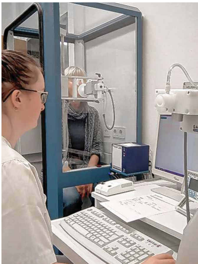
Lungenfunktions-Diagnosen, mögliche Therapien und Tipps am Vortragsabend in der Gesunden Gemeinde