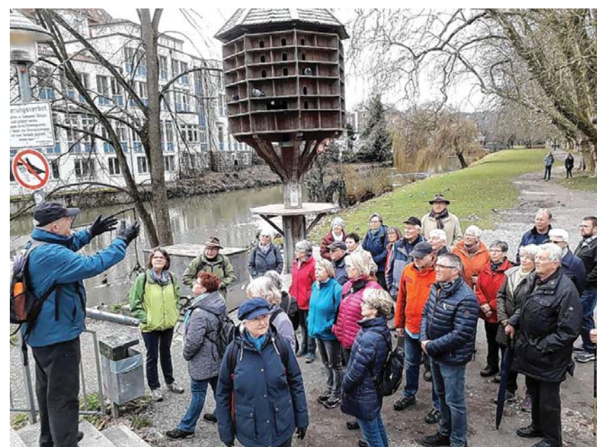
In der Platanenallee

Eine Besonderheit war die Querung des Hasengässles oder der „sieben Wenkele“, die vielen unbekannt war. Beim „Löwen“ musste dann der Fasnetsumzug gequert werden, um hinter dem Kornhaus am Kanal entlang und vorbei an der neugotischen katholischen Kirche zum Nonnenhaus zu gelangen. Am Ende der Nonnengasse war nach Querung der Gasse hinter dem „Schimpfeck“ auch das Ende der zweistündigen Wanderung gekommen. Die Einkehr in der „Wurstküche“, dem originellen Altstadtlokal, passte zum Thema. Nach der Einkehrpause führte der Rückweg über die „Palmerstaffel“ Richtung Hauptbahnhof.