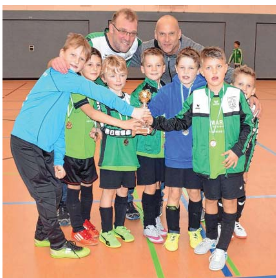
3. Platz für den TSV Eningen