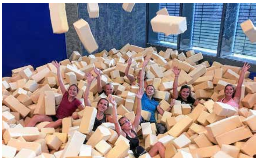
Die Mädels in der Schnitzelgrube

Auch in den Ferien trainieren unsere Turnerinnen, damit sie in der Liga mithalten können. Im Sportinstitut in Tübingen haben sie dafür die idealen Bedingungen und diese Halle ist auch in den Ferien geöffnet.