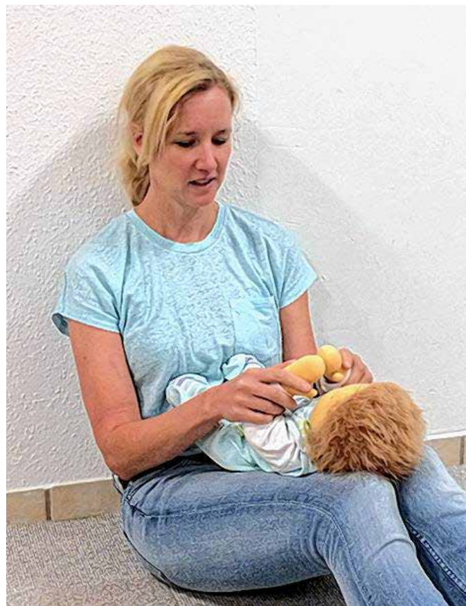
Die Entwicklung und Begleitung von Säuglingen- Workshop der kidKG mit den Flüchtlingen

Der Arbeitskreis Gesunde Gemeinde freut sich über das erfolgreich durchgeführte Projekt und sagt Danke.