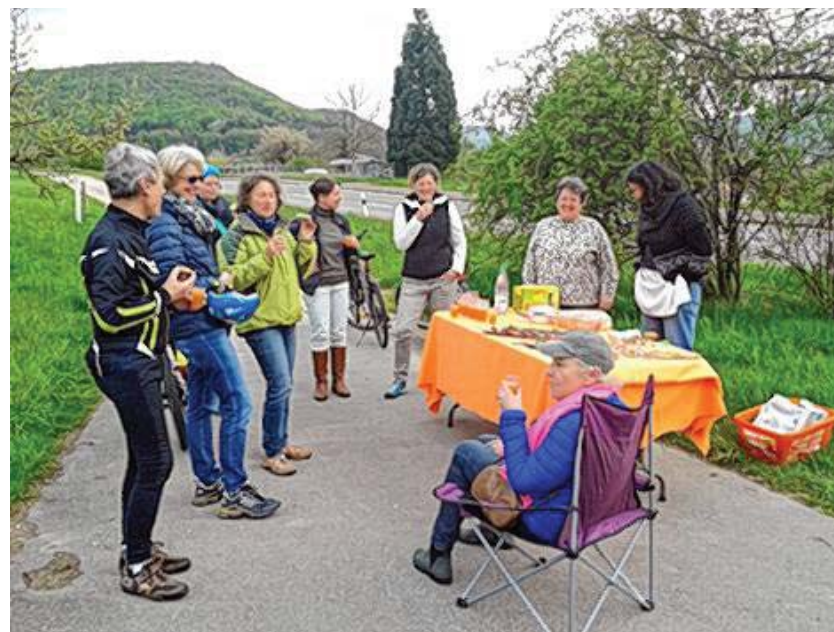
Auch dieses Jahr stehen der Spaß an der Bewegung und der Austausch an der gemeinsamen „fröhlichen Radtour“ wieder im Vordergrund

Weitere Informationen: www.ForumGesundeGemeinde.de