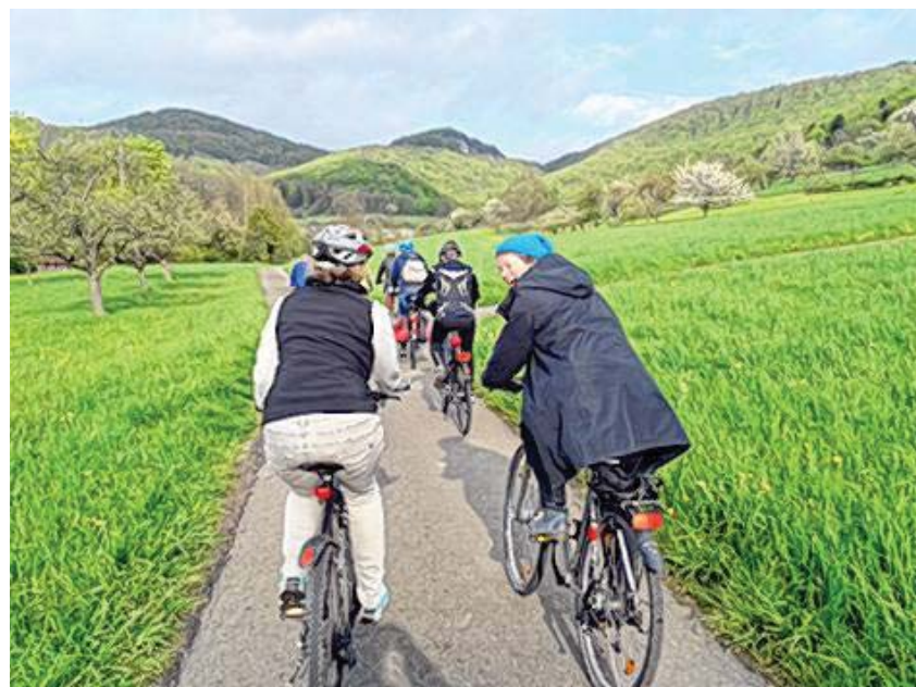
Einladung zur Bürger-Radtour für alle Altersklassen am 20. Juni

Auch dieses Jahr werden in der Verschnaufpause wieder regionale Getränke und Stärkungshappen vom Eninger Erika'le angeboten. Bei der geplanten Pause kann der Blick auf die schön gelegene Gemeinde Eningen unter Achalm genossen werden.