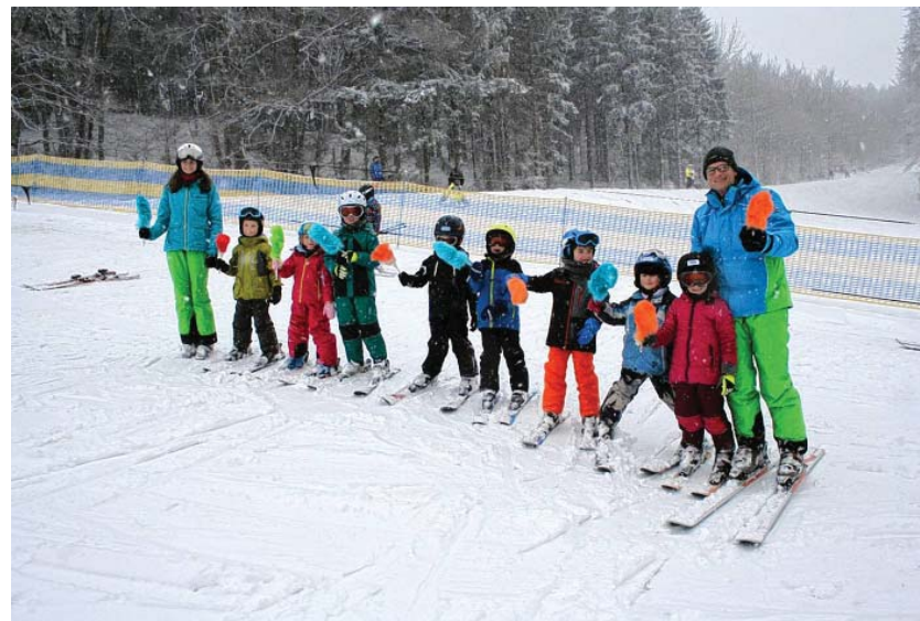
Skikurse auf der Alb