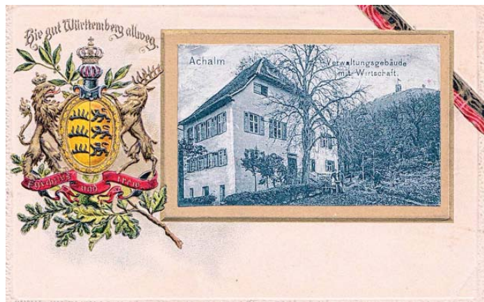
Achalm. Verwaltungsgebäude mit Wirtschaft

Diese schöne Prägekarte datiert von vor 1905; die Achalm befand sich in jener Zeit in königlichem Besitz. Linkerhand sehen wir das Wappen des Königreichs Württemberg.