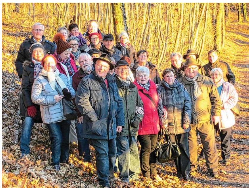
Bei der Jahresabschluss-Wanderung