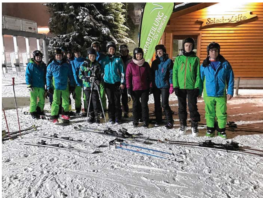
Flutlichtkurse in der Wintersportarena