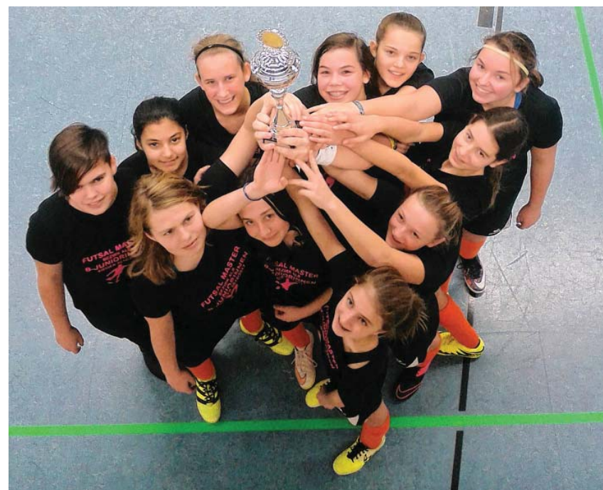
B-Futsal Masters Sieger 2016/17